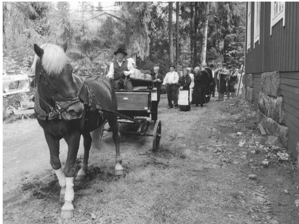
Historiallinen kulkue saapumassa juhla kentälle.