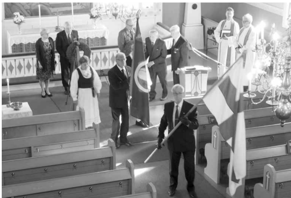
Seppelvartio lähdössä kirkosta sankarihaudalle.