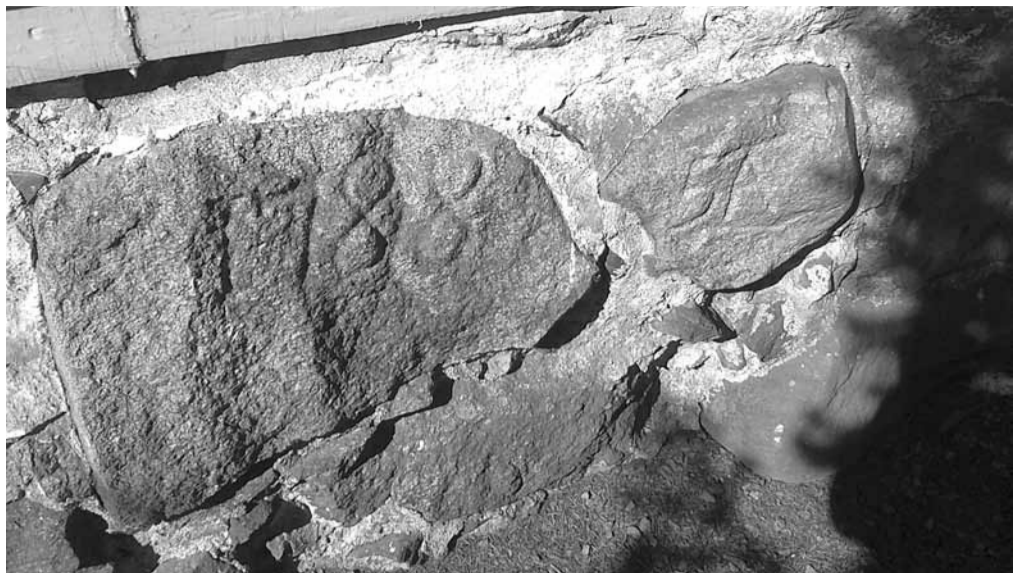
Kivijalkaan lyödyt merkinnät Tarvasjoen kirkon sokkelissa.