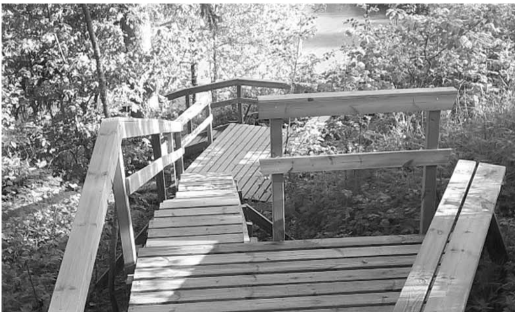
TARU:n myötävaikutuksella rakennettiin turvalliset portaat padon alapuolen suvanon rannalle luontopolulle kulkijoita ja melojia varten.