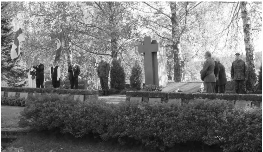
Seppeleen lasku sankarihaudalle.

Sanotaan, että menneisyys on peili, joka näyttää heijastuksia tulevasta tapahtumista. Siinä tapauksessa te, jotka olette kokeneet