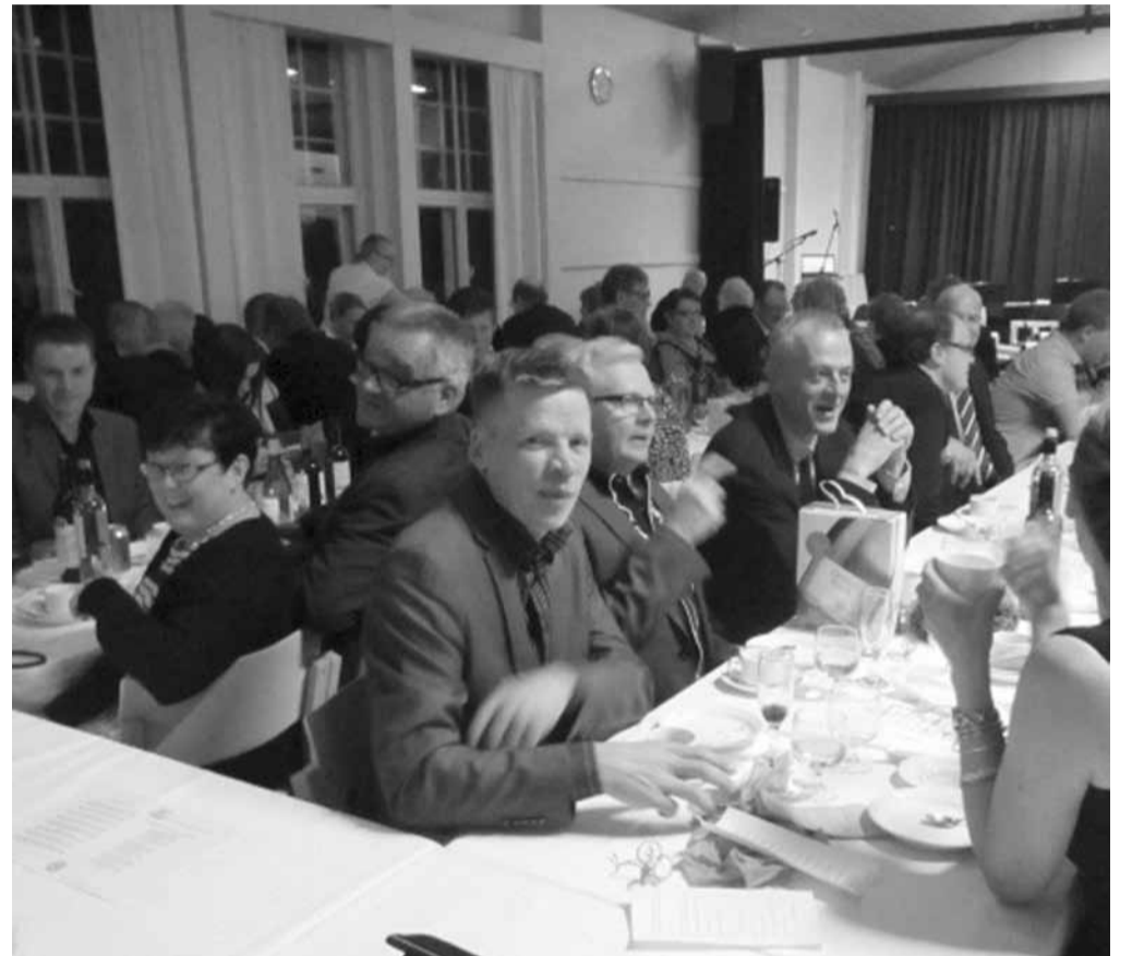
Kuva Tarvasjoen Nuorisoseuran 120-vuotisjuhlasta.