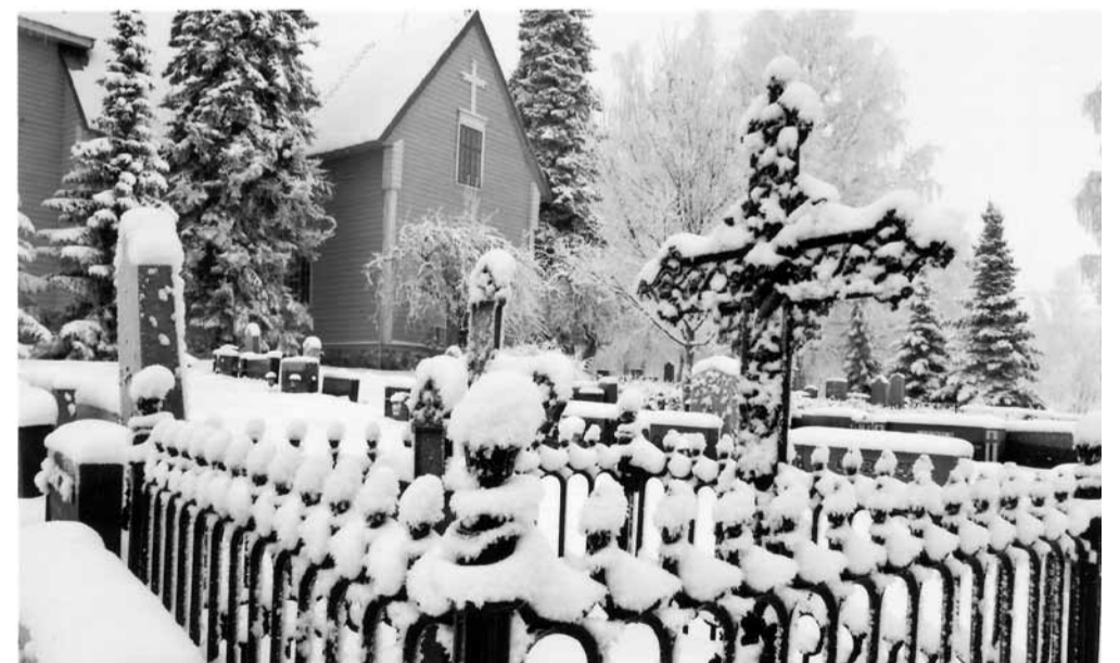
Jouluinen hautausmaa.