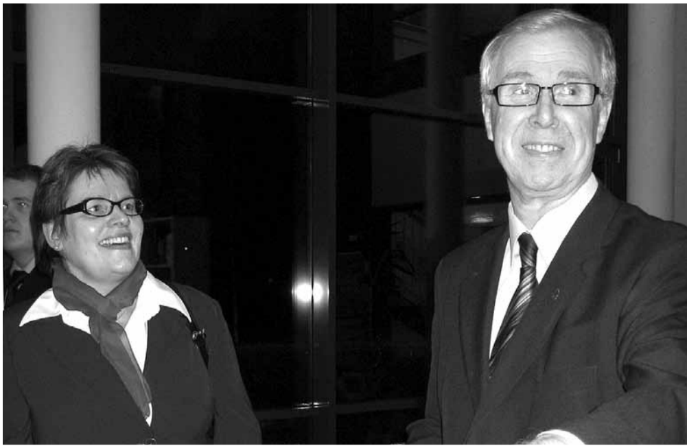
Tarvasjoen entinen ja nykyinen kunnanjohtaja ovat tyytyväisiä koulun kehitykseen sen 10-vuotisjuhlassa.

pieniä kuulemma välillä meni kesken välitunnin jalkojenkin välistä.