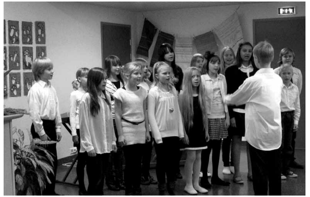
Musiikkiluokan kuoro esiintyi juhlassa.

Vanhempien kanssa yhteistoiminta on tärkeää. Valtaosan kanssa olemme samalla aaltopituudella heti, mutta kokemus on opettanut, että jos joskus opintien alkuvuosina on ollut jotain ristiriitaa, niin viimeistään yläkouluvaiheessa puhallamme jo lähes sataprosenttisesti yhteen hiileen oppilaan parhaaksi. Henkilökuntamme tavoitteena on, että ongelmiin puututaan ja niitä