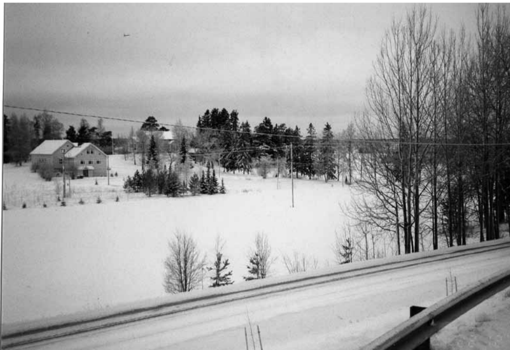
Euran koulu vuosituhatosen vaihtuessa jouluna 1999.