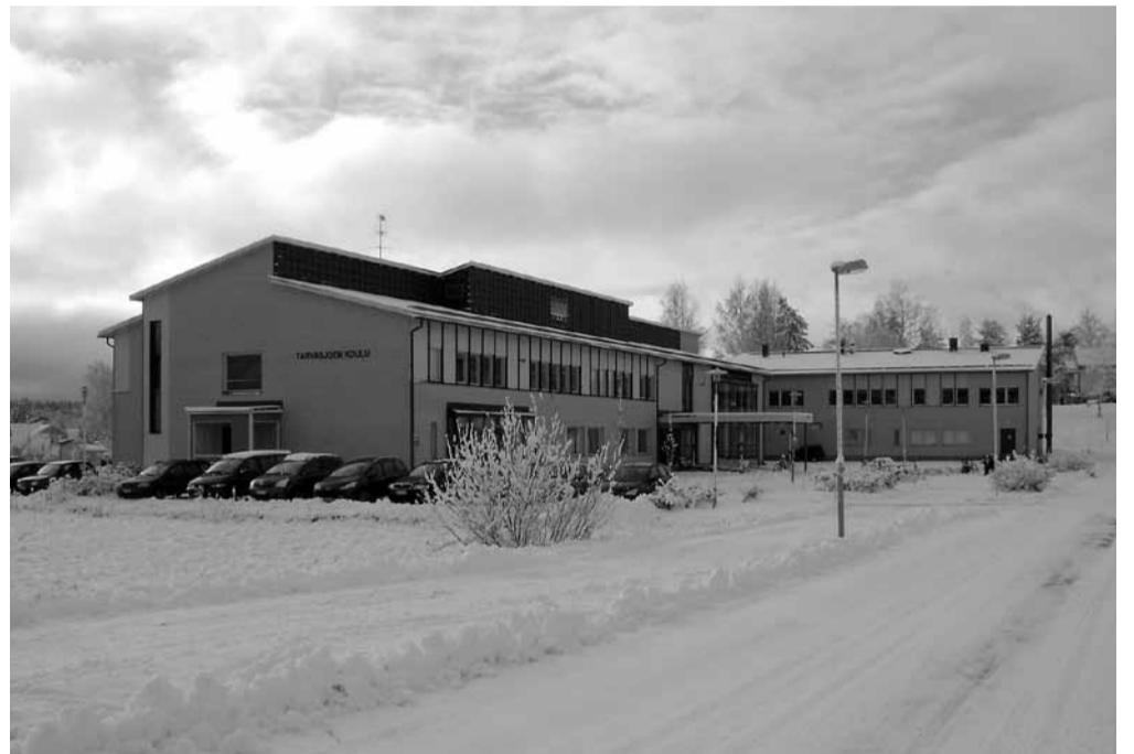
Tarvasjoen koulu 10 vuotta myöhemmin.

Kymmenen vuotta! Muistan hyvin, kun itse täytin kymmenen ja olin mielestäni jo aika vanha, kun kakussakin oli jo kymmenen kynttilää. Nyt en enää niin ajattele, vaikka se on myönnettävä, että onhan 10 vuotta jo melko pitkä aika ihmisen elämässä. Meitä on monta henkilökunnassakin, joilla tulee tänä vuonna kymppi täyteen Tarvasjoen koulussa. Samalla se on juuri se ajanjakso, jonka oppilaat viettävät koulussamme, ensin esiopetuksen ja sen jälkeen koko perusopetuksen oppivelvollisuuden.