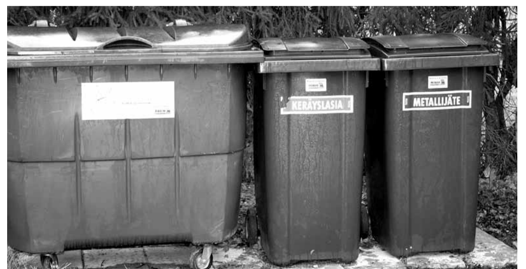
Uudet jäteastiat.