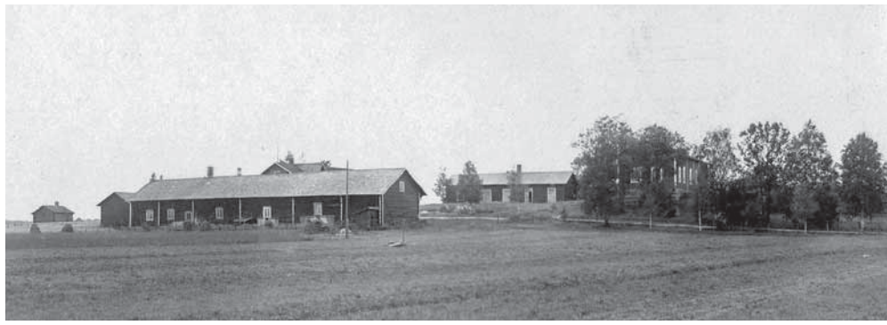
Sepän talo Euran kylän mäellä vanhan navetan aikaan.

muista, sittemmin rakennettua meijeriä vastaapäätä, missä Simolan tila vieläkin on.