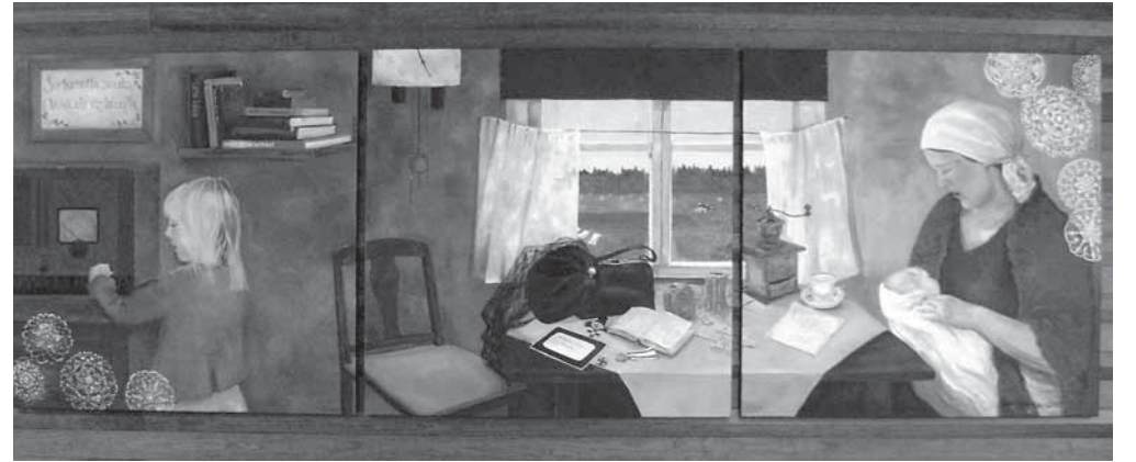
Tiina Rauhalan: "Sankaritar".