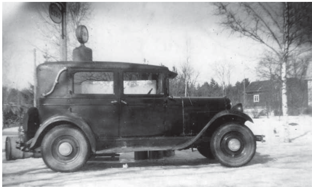
Keskipitäjän poikien Chevrolet, lempinimeltä Hispano.