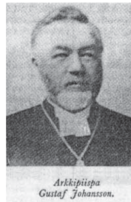
Arkkipiispa Gustaf Johansson.