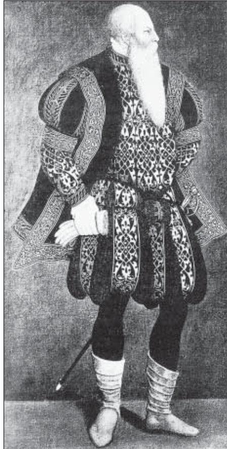
Kuningas Kustaa Vaasa. Willem Boyn maalaukselta 1557 Gripsholmin linnassa.

Jo talvella 1556 kaadettiin ne puut, joista veistettiin hirret ja sahattiin laudat uuden kuninkaankartanon rakennuksiin. Työtä tekivät veropäivätöinään seudun talonpojat, joiden ilmoitetaan kaataneen 2408 tukkia, joista osasta sahattiin 1560 lautta. Lisäksi kiskottiin 1287 leiviskää