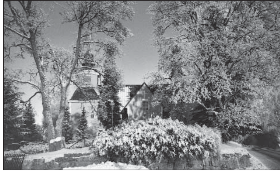
Kirkko ja hautausmaa olivat lumivaipassa marraskuussa 2006.

lissä, sähkölamppu, katulamppu – ihminen on aina kaivannut enemmän ja aina vain enemmän valoa. Kyllä pelkän kynttilänvalon aikaan marras- joulukuisen päivän on täytynyt olla mahdottoman lyhyt, kun se tuntuu lyhyeltä nykyäänkin, vaikka monenlaisilla valoilla pystymme päivää venyttämään. Joskus on kuunvalostakin ollut ihan työnteollista hyötyä. Minkäänlainen keinotekoinen valo ei koskaan voi täysin tyydyttää ihmisen valonkaipua. Todellinen Valo syytyi pimeänä jouluyönä Betlehemin tallissa. Päästessään tuon todellisen Valon säteilystä osalliseksi ihmisen mieli tyyntyy. Jeesus on tie pimeydestä valoon. Emmekö me sen tähden laita jouluna valoja kaikkialle, että ne muistuttavat meitä todellisesta joulun Valosta?