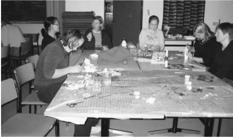
Suurin osa lauantai-iltapäivästä kului pieniä askartelupuhteita tehden.

Joukko ei ollut toisilleen entuudestaan täysin tuttua. Pulina ja porina oli melko