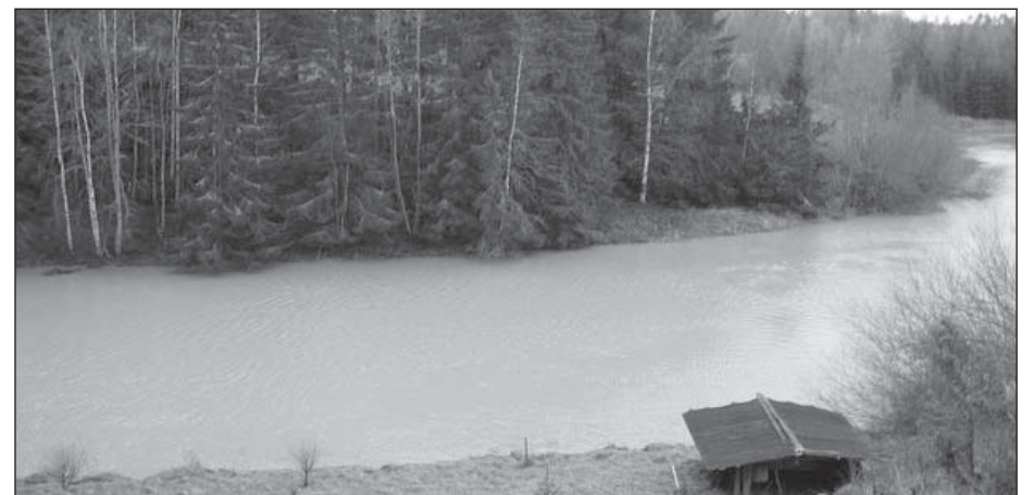
Juvan kuninkaankartanon rakennuspaikan Paimionjoen rannalla peittää nykyisin metsä. Kuvassa näkymä eräänä marraskuun hämäränä päivänä Moision pihalta katsottuna kartanon entiselle sijaintipaikalle yli vuolaan Paimionjoen.

Juvan kuninkaankartanon perustaminen nosti Tarvasjoen neljän nimismieskunnan alueella sen voutikunnan keskuksiksi ja maatalouden esikuvaksi seutukunnan viljelijöille. Valitettavasti näin alkanut kehitys ei jatkunut suotuisana yhteiskunnan rauhattomuuden ja kasvavan verorasituksen paineessa. Noista ajoista lähtien kuitenkin Juvankoski ja sen myllyt jauhoivat erinomaista suomalaista ruista koko Ruotsi - Suomeen ja toivat Juvan ja tämän seudun valtakunnassa laajempaan tietoisuuteen.