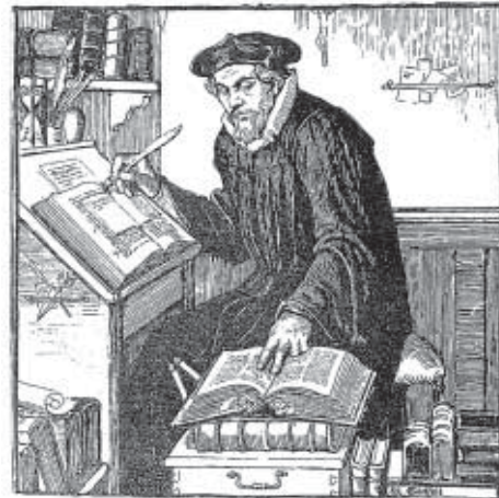
Mikael Agricola. Albert Edelfeltin piirros.

Vierailun lopputuloksesta päätellen Kustaa-kuningas ei ollut aivan tyytyväinen Juvan kartanon kehitykseen. Rakennukset oli hyvin rakennettu, peltoa raihattu ja myllyt toimivat, mutta sadot olivat heikkoja. Syyksi siihen arvellaan