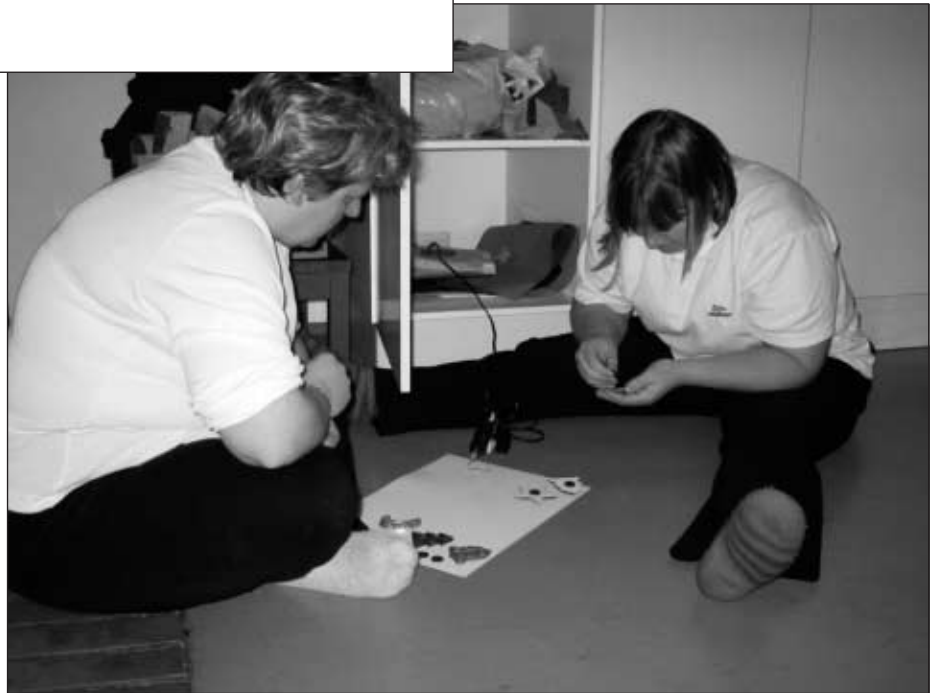
Nekin meistä, jotka kuvittelivat olevansa vähemmän käteviä askartelijoita, löysivät itsensä toteuttamasta kädentaitoja pensselit kourassa ja näpit liimassa.