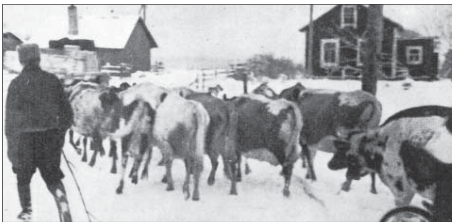
Talvisota on syttynyt ja on lähdeettävä evakkoon. Karja oli ajettava navetoista talviselle maantielle. Matka uusille asuinsijoille alkoi.

Tulo Tarvasjoelle oli ensin ankea. Kättylänstä saatu maapala oli seudun karuin