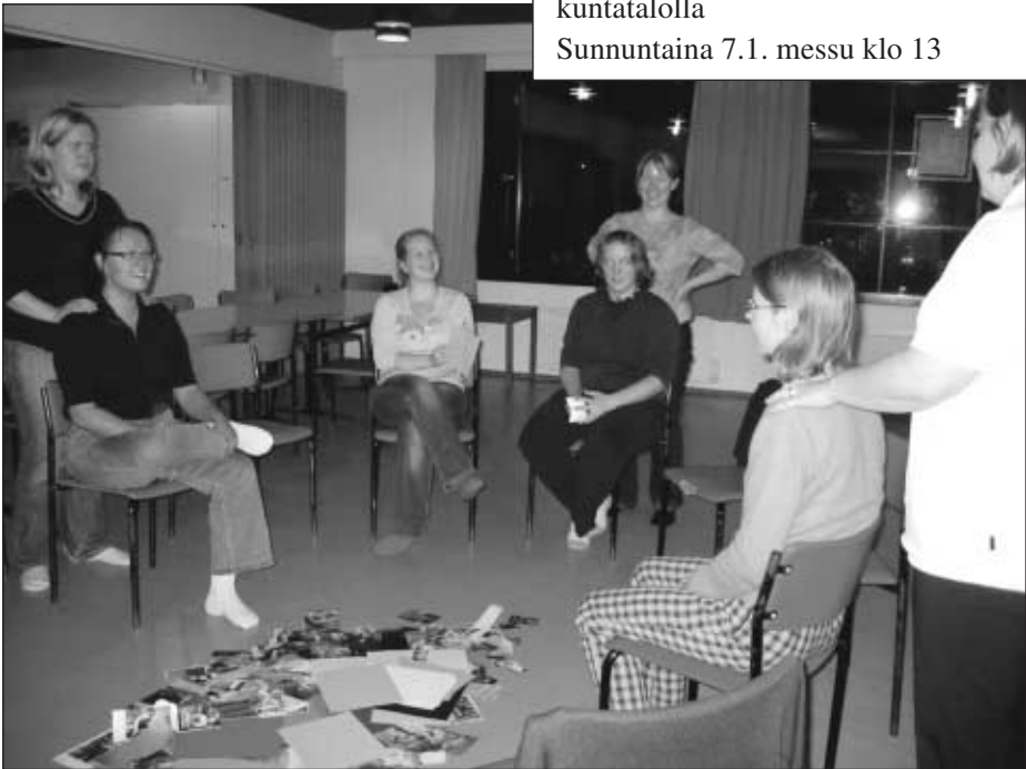
Illansuussa pysähdyimme pohtimaan tunteita ja niiden vaikutusta elämään. Moni hieraisi hartioitaan ja huokaisi ankan mietiskelyn jälkeen. Päätimme ottaa käyttöön hartiahierontapiirin.