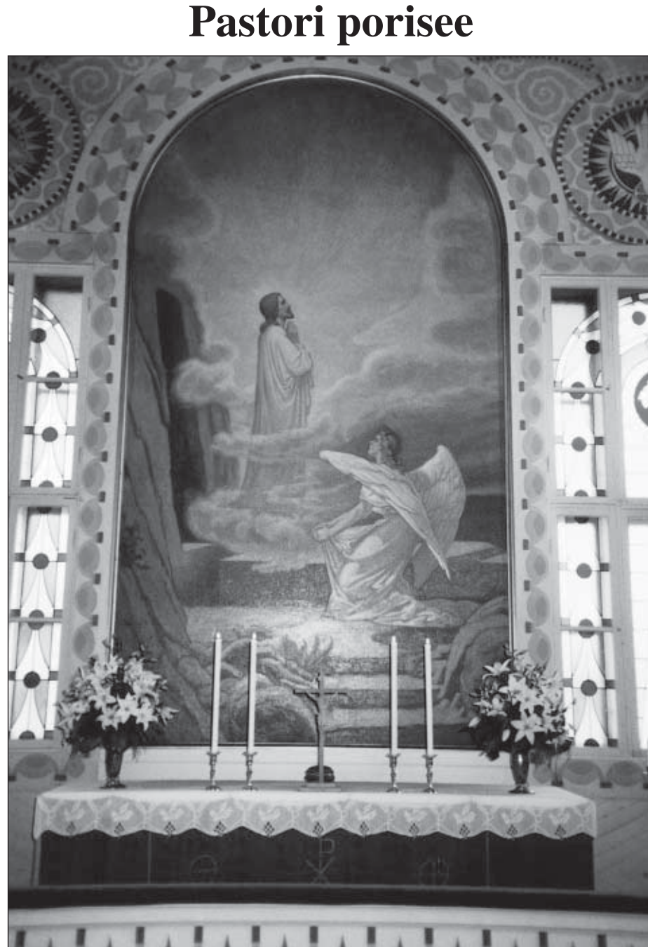
Kotikirkon alttari kutsuu taas joulun aikaan.

Seurakunnan talouden tasapainottamiseksi on tehty kovasti työtä. Valoa tunnelin päässä näkyy; muutama arkkihiippakunnan talousasiantuntija on sitä mieltä, että vaikeimmat vuodet rahan suhteen saattavat hyvinkin olla takanapäin. Tiukkaa taloudenpitoa on harjoitettu siksi, että voisimme osoittaa Kirkkohallitukselle ja Turun tuomiokapitulille pärjäävämmme omillamme. Nyt maassa jylläävän kuntarakenteen uudistusten myötä näyttää kuitenkin siltä, että jossain vaiheessa meidän seurakuntammekin liittyy