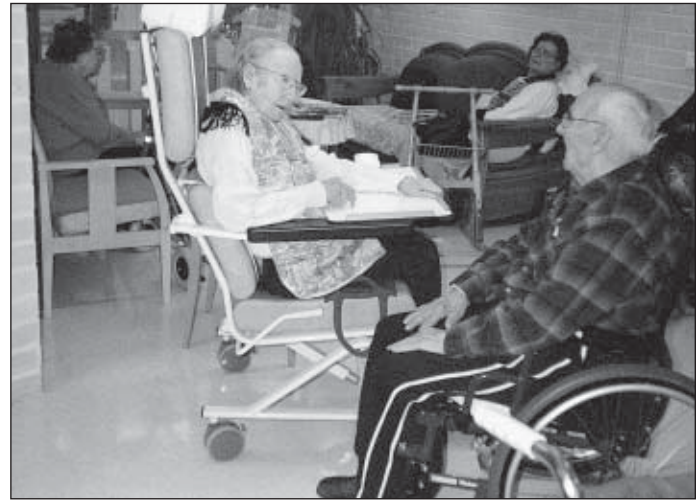
Vanhosten tuttuun juttuhetki.