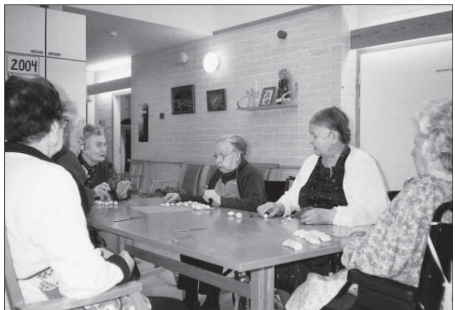
Pullien leivontapäivä Ketolassa.