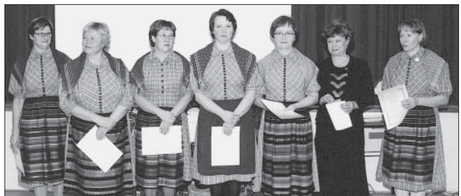
Ansioimerkeillä palkitut martat.