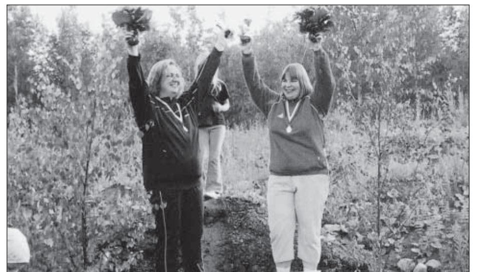
Kuvasarja pitäjän kesäjuhlien kuulantyöntökisasta.