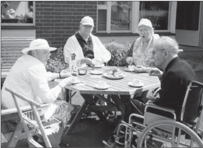
Kesäinen kahvihetki Palvelukeskuksen pihalla.