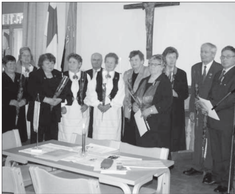
Ansioimerkkien saajat ryhmäkuvassa.