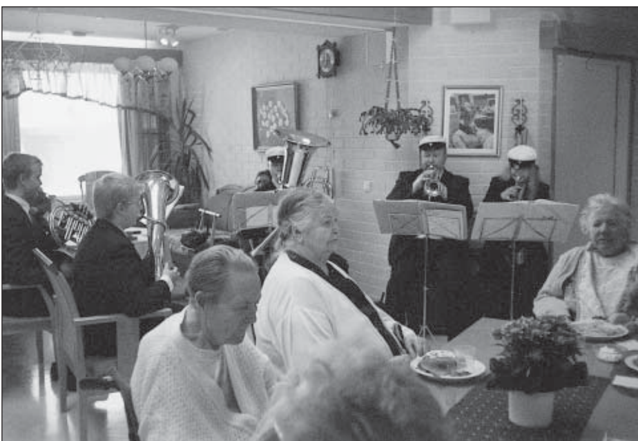
Vappuna iloksemme soitti torvisoittokunta Pöytyältä.

Talon ovi käy tiuhaan myös iltaisin, yhdistykset kun kokoontuu. Pienet juhlatkin tiloissa näissä pidettäväksi onnistuu. Nytkin juhlissa täällä me olemme vuosikymmentä juhliitaan. Mitä tapahtuu sitten edessäpäin sen vuodet tuo tullessaan.