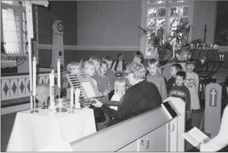
Lapset saavat tulla Jeesus sanoit niin .... kerholaiset laulamassa.