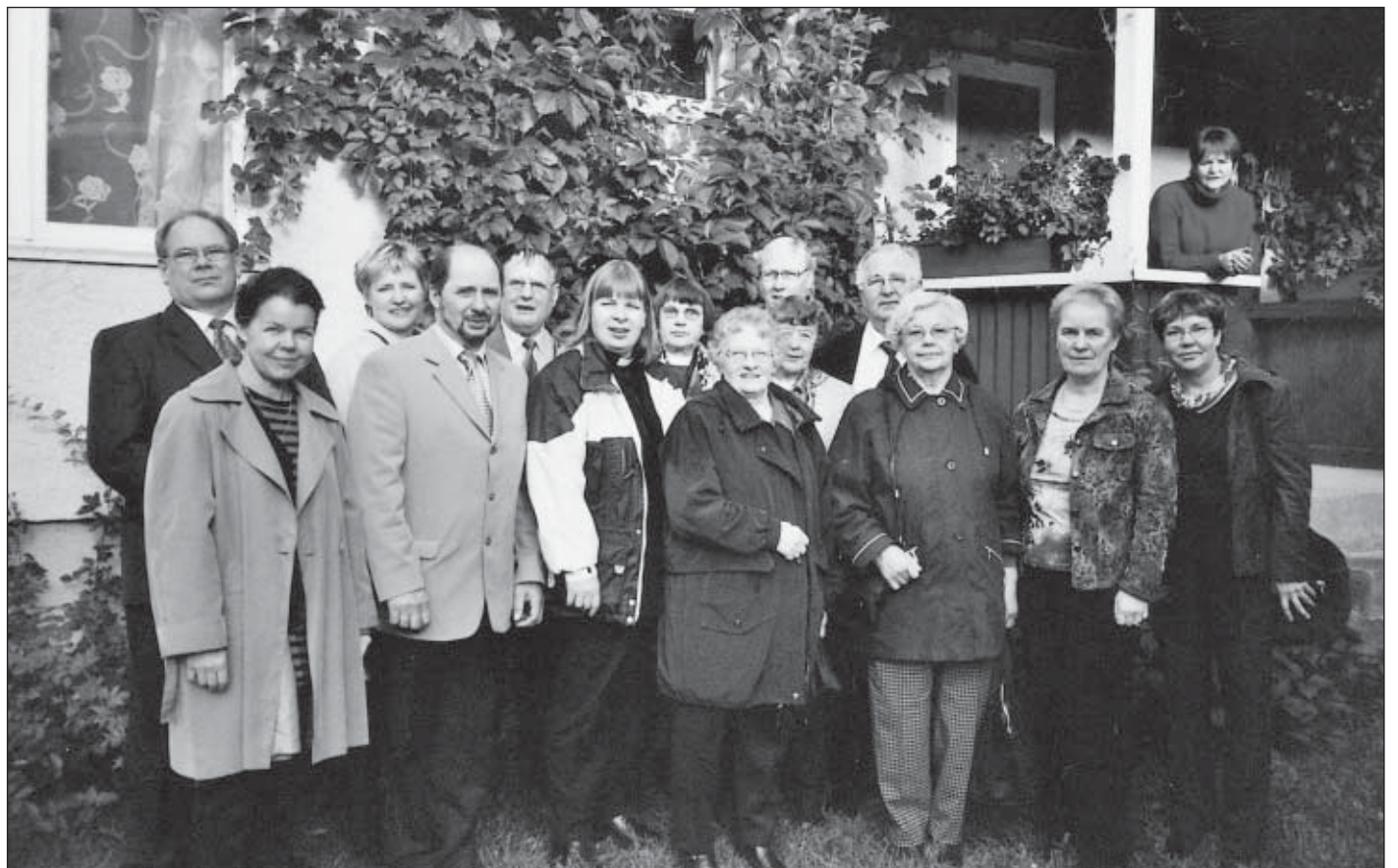
Tarvasjoen seurakunnan edustajat Nõvan matkalla. Kotiin lähdön tunnelmissa Ruusutalon edessä 26.9.2004.