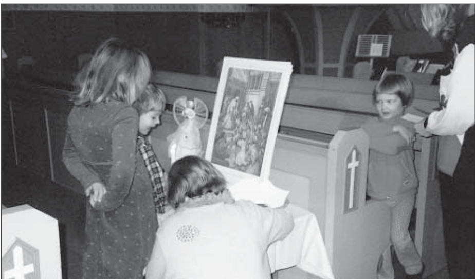
Jonoa lasten alttarilla.