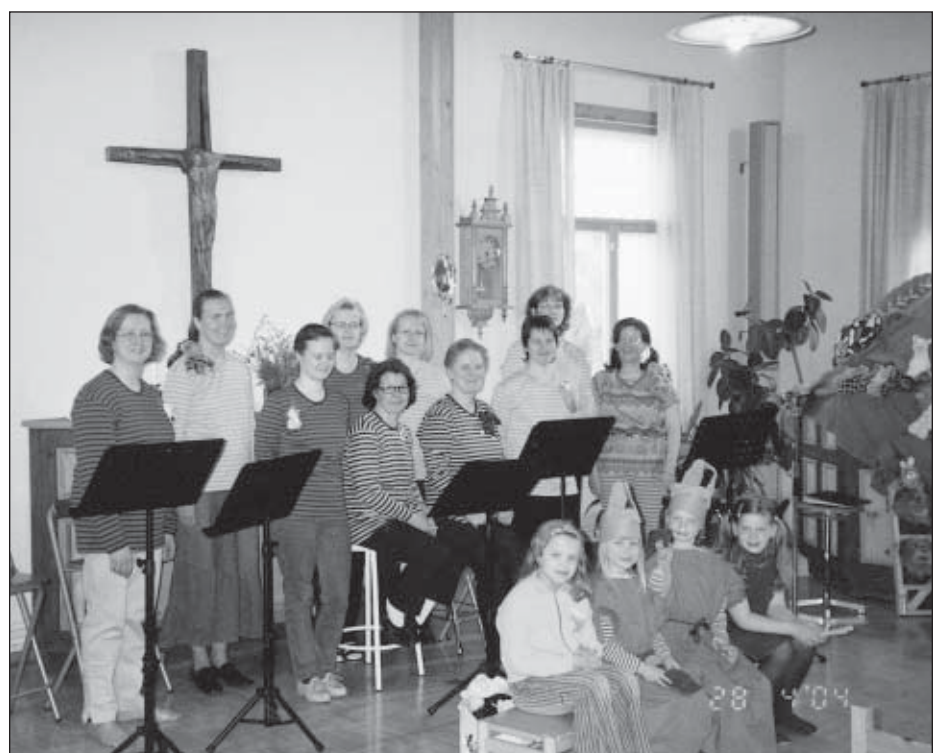
Lauluryhmä Mantelit ja lapset.

Harjoitusvaihe Zoopperan kanssa oli raskas kun tietystä ajassa piti saada yhdeksän laulua esityskuntoon. Hyvä harjoittelu on palkittu nyt jälkepäin kun esitys on kiertänyt eri pitäjissä. Ryhmä-