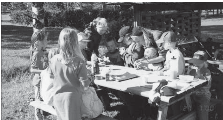
Askarteluhetki leikkikentällä kesällä 2000.

Yhdistyksen toiminnan alusta lähtien on järjestetty tiedotusiltoja ja -kursseja eri aiheista. Ajankohtaisia aiheita eri vuosikymmeninä ovat olleet mm. terveystieteiden, kotivalmiuskurssit, äitikirjat, hyvän käytöksen kurssit, kodin ja koulun yhteistyöillat ja vanhempainillat. Mainitut kotivalmiuskurssit järjestettiin mm. vuonna 1958, jolloin pöytäkirjamerkintä kertoo, että ”kurseille kutsutaan 17 v. täyttäneitä neitoseja ja nuoria rouvia” ja ohjelmaa järjestetään eri aiheista neljänä huhtikuun iltana. 60-luvun alussa järjestetyt hyvän käytöksen kurssit rippikoululaisille ja myöhemmin kansalaiskoululaisille todettiin tarpeelliseksi ja saivat hyvää palautetta. Vuonna 1974 suunnitellaan ollut ”nuorten parien avioliittokoulu” ei hyvästä ideasta huolimatta ilmeisesti toteutunut, olisiko syytä ollut aiheen vaikeus. Ompeluiltoja