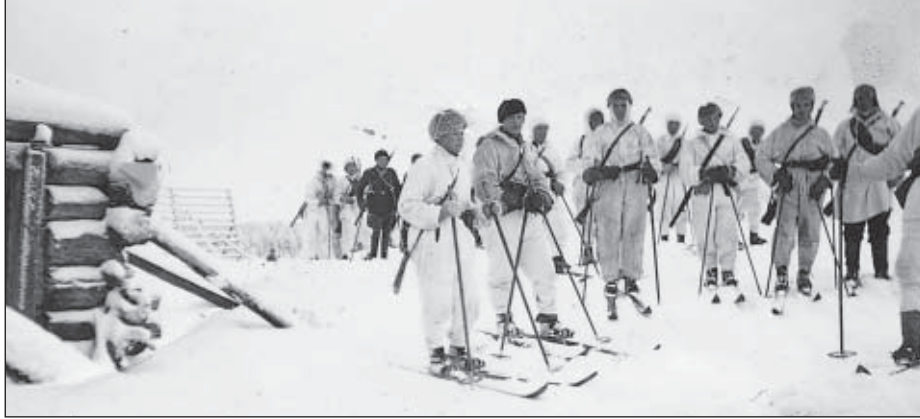
Partiomatkalla 3.3.1942 otettu kuva.