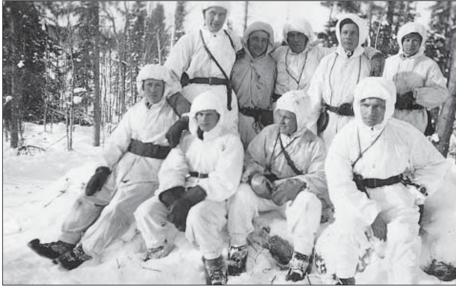
Väsytynyt joukkue partiomatkalta paluun jälkeen 5.3.1942 Kiestingissä Vienan erämaissa.