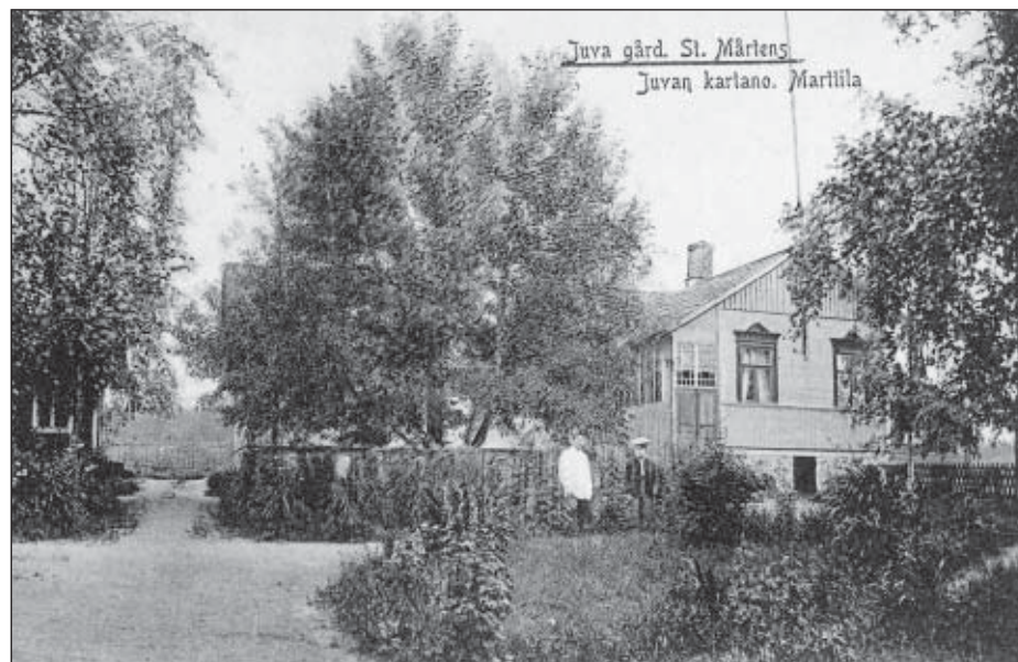
Vanha maisemakortti Juvan kartanosta kertoo sen olevan Marttilassa.