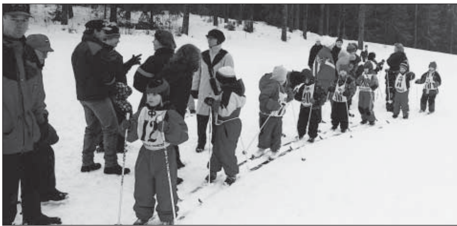
Nappulahiihtojen lähtö helmikuussa 2000.

Vuodelta 1944 löytyy pöytäkirjamerkintä, jossa ”päätettiin ostaa lampaita, mikäli niitä on saatavissa ja sijoittaa ne lapsirikkaisiin puutteellaisiin perheisiin.” Hammashoito laajennettiin koskemaan kaikkia alle 15-vuotiaita ja vanhempiakin tarpeen mukaan. Eräälle suurperheelle äidille päätettiin laitattaa