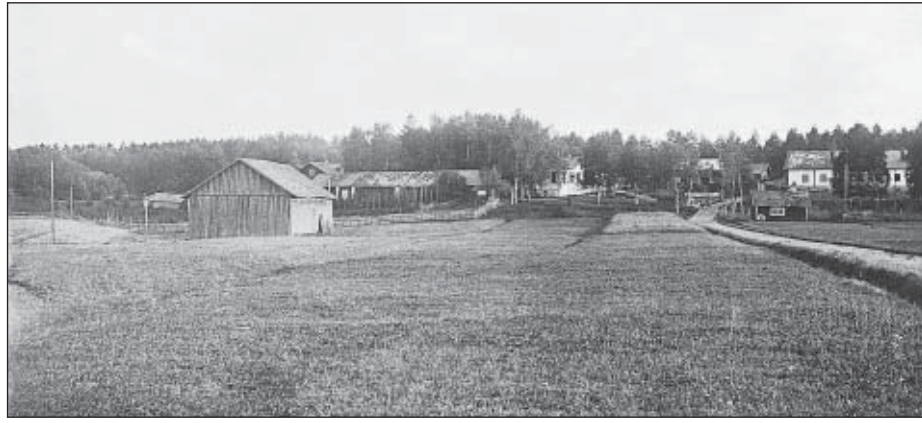
Kuva 1930-luvulta Juvan kartanosta Paimiontieltä katsottuna.