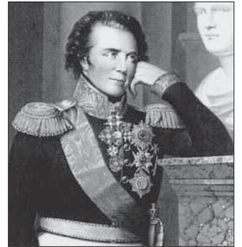
Kustaa Mauri Armfelt.