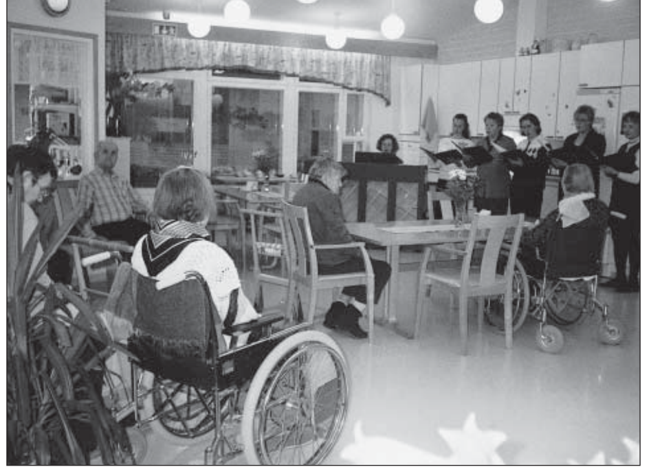
Palvelukeskuksen avointen ovien päivä. Esiintymässä lauluyhtye Mantelit.