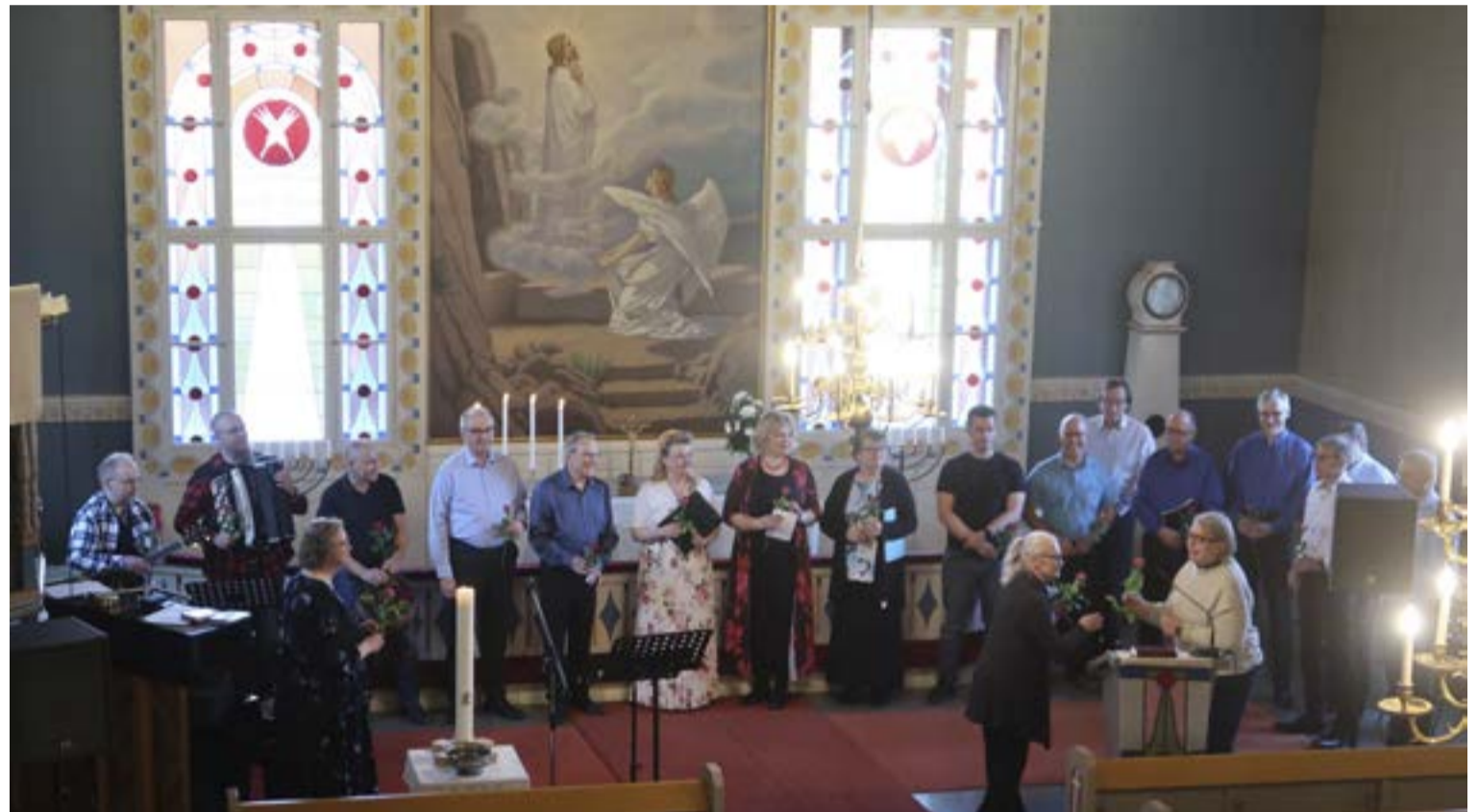
Yhteisvastuukonsertin 19.4.2026 esiintyjät kukitettiin tilaisuuden päätteeksi.