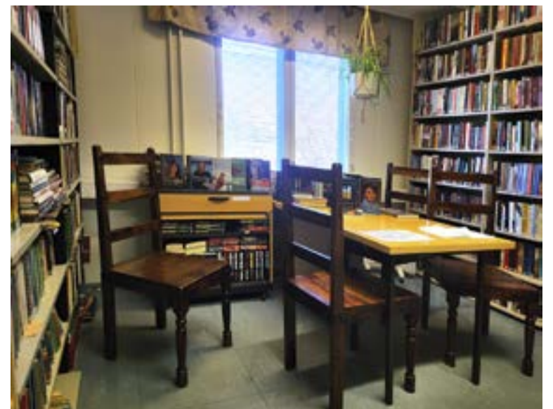
Kyläkirjasto on avoinna keskiviikkoisin ja kuukauden ensimmäisenä sunnuntaina.