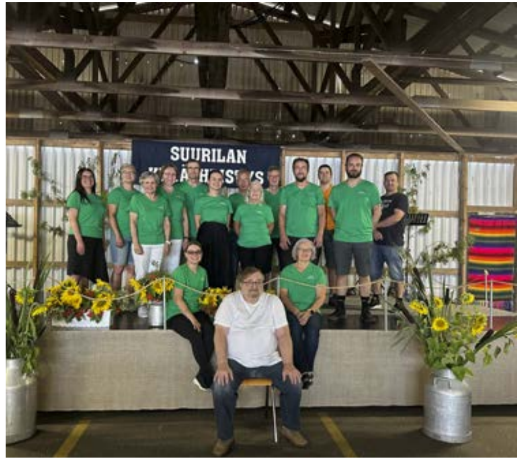
Vuoden 2024 Suurilan oopperajuhlien talkooväkeä