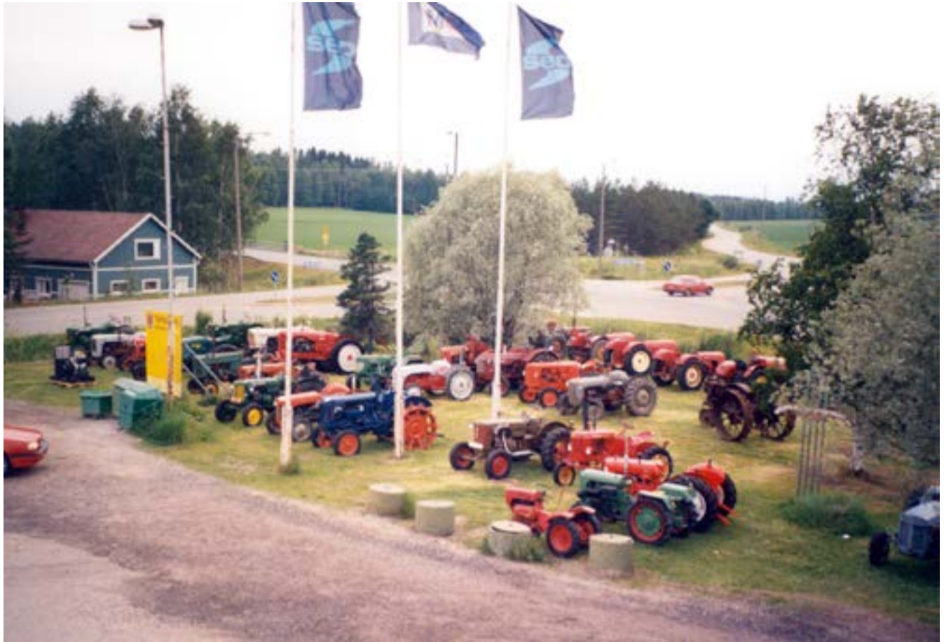
Uitonkulman Siivapyöramiesten traktorinäyttelyt ovat jääneet monen ohikulkijan mieleen maamerkinä Tarvasjoesta.

Auranmaan Viikkolehdessä julkaistu mainos 10-synttäreistä.