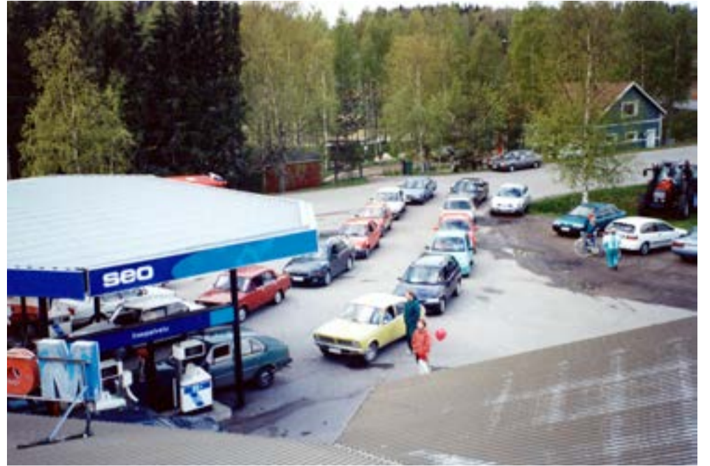
10-vuotissynttäreillä nähtiin bensatankeilla useiden autojen jonoja.