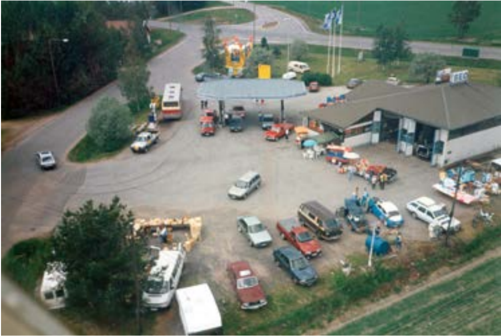
Tarvasjoen SEO on vuosien varrella tarjonnut myös kansanhuveja viettäessään juhlavuosia.