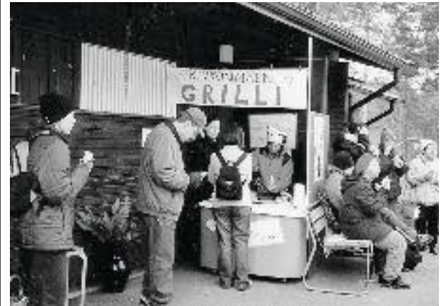
Kirkonmäen Grilli oli menestys ja moni ohikulkija olisi varmasti halunnut piipahtaa haukkaamassa välipalaa kauniilla kirkonmäellämme ja vielä hyvässä seurassa.

Saapa nähdä, koska Kirkonmäen Grilli seuraavan kerran kokoaa itsensä kirkon tai seurakuntatalon nurkkiin ja ilahduttaa herkuillaan.