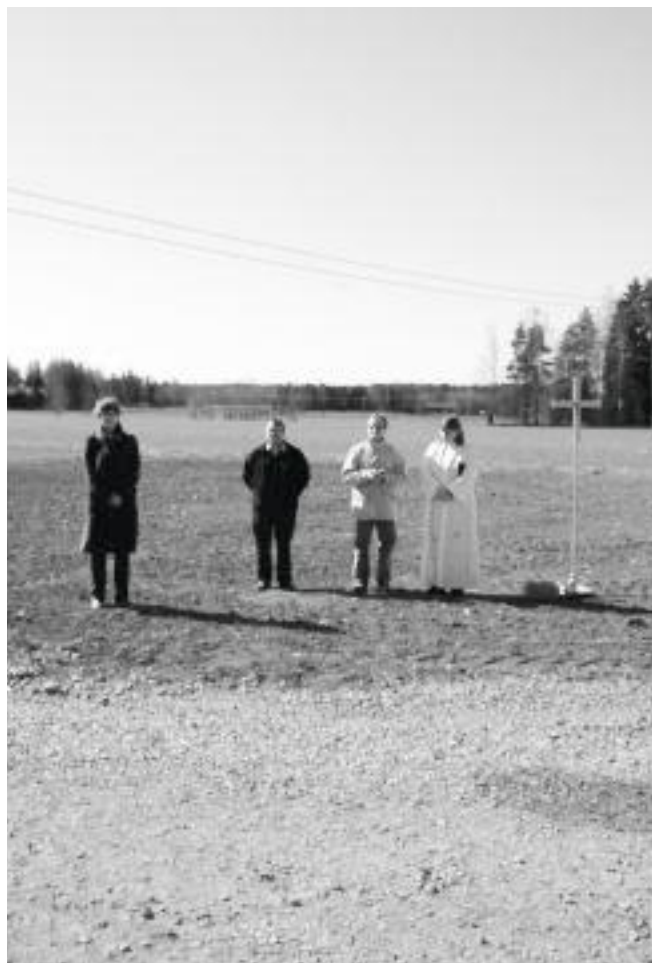
Kylvönsiunaus 5.5. Horristen peltojen laidalla