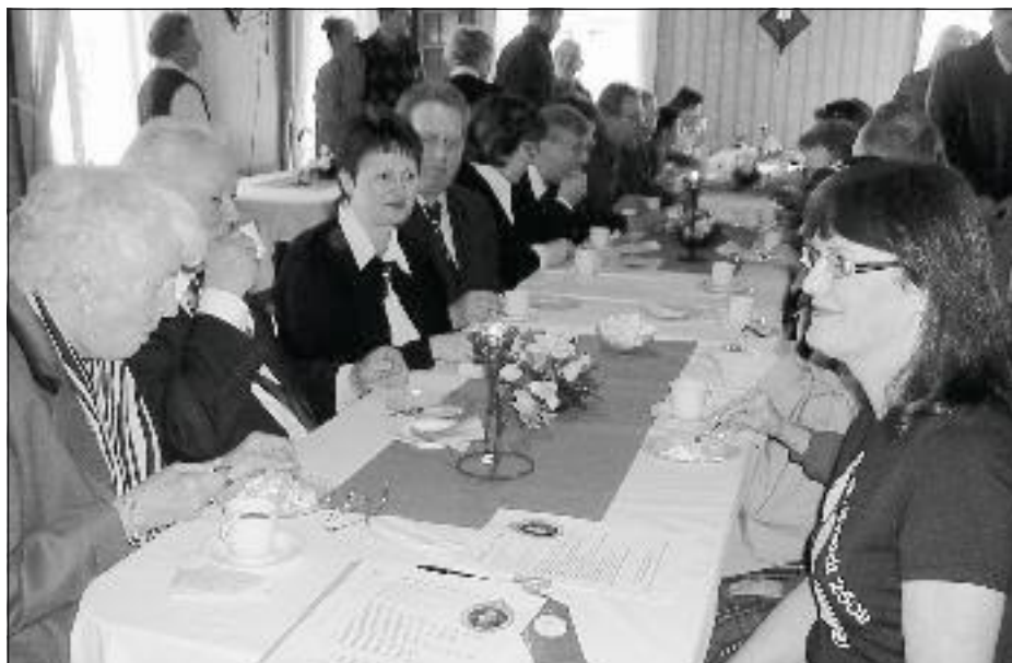
Kuningas Kustaa III ja Kustaa Mauri Armfelt sekä juhlayleisöä syntymäpäiväjuhlassa 31.3.2007 Juvan kartanossa.