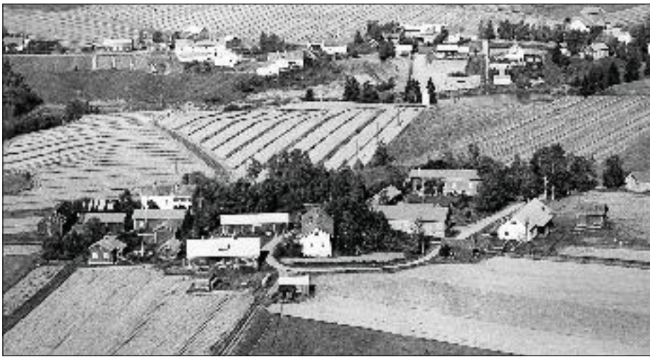
Ilmakuva Euran kylästä 1950-luvulla etelästä päin katsottuna. Edessä keskellä Vanhatalo, vasemmalla Samsten ja Uusitalo, oikealla Seppä.

Entisaikojen taajaan rakennetut ryhmäkylät olivat hyvin alttiita suurille tulipaloille. Talot olivat isojakoon asti enimmäkseen umpipihoja, joissa ainoastaan sauna ja riihi usein kaikkein tulenarimpina olivat rakennettu erilleen kylästä. Kylien talot taas oli rakennettu lähelle toisiaan ulkopuolelta uhkaavan vihollisen tai suurpetojen pelossa. Kylät Tarvasjoella olivat pääosin ryhmittyneet joen törmille tai keskellä kylää olevalle mäelle. Ryhmäkylässä oli suppealla alalla suuri puumassa. Tulenarat kattomateriaalit olki, tuohi, lauta tai päre taas lisäsi alttiutta tulen tuhoille.