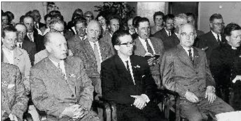
Kirjaston 100-vuotisjuhlan yleisöä Tarvalassa 22.6. 1958.