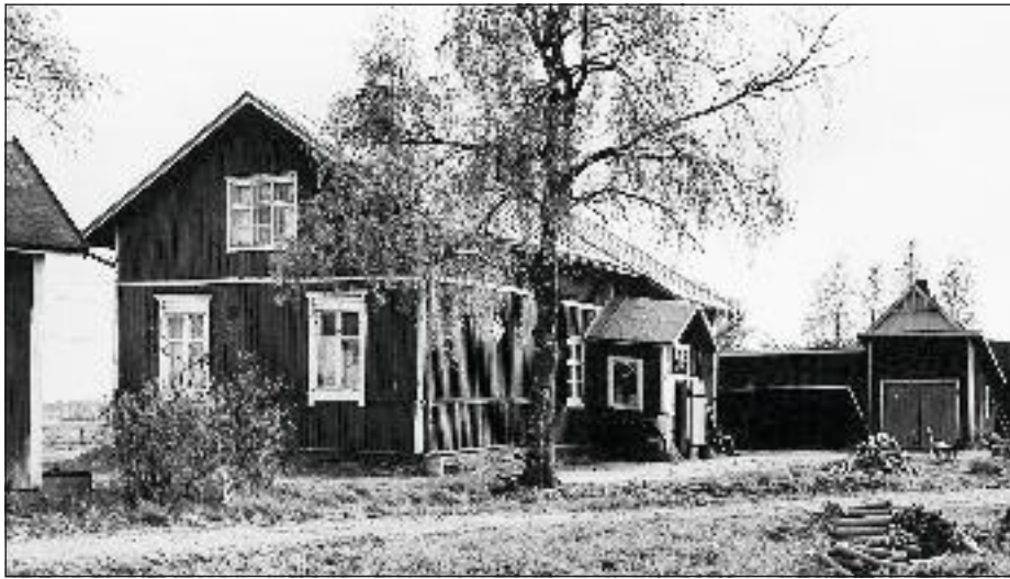
Vanha kunnantalo Kuukkala, jossa kirjasto toimi 1931–1948.