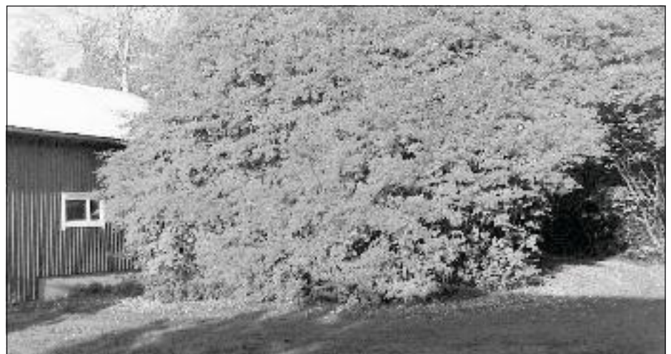
Herra Trekoliin aikanaan tuodut tuomipihlajat kasvavat edelleen tuuheina Hungerlan talojen pihloissa.