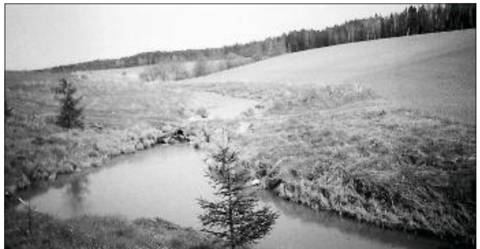
Savijoessa näkyy edelleen kala-aitalle tehty levennyys, jossa myös hevosia uitettiin. Myös yli joen tehty kivisilta on edelleen kunnossa.

antaneet kylälle haukkumanimen, kun eivät kylästä saaneet palkkasaataviaan. Suuri tila oli manttaalien suuruinen ja sen verorasitus oli suurin. Meidän talo, Lampo, oli neljännesmanttaalia ja senkin verot tuntuivat raskailta. Luontaistuotteissa maksettu kirkollisvero manttaalien