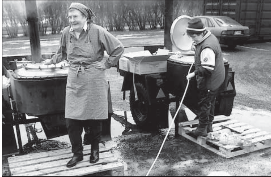
Laskiaisen hernekeitossa 2002.