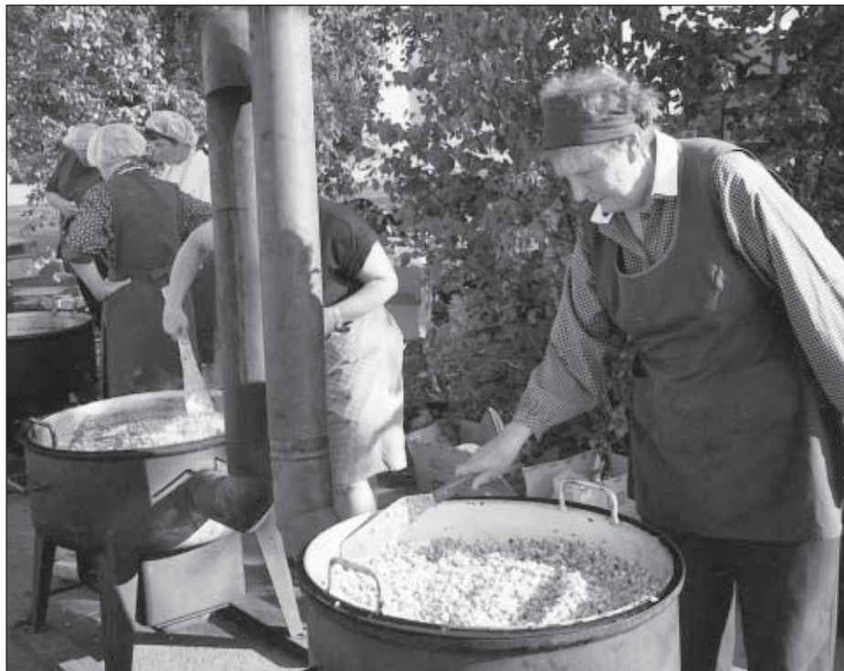
Kokkina Tall Ship Race 2003 -tapahtuman miehistöjuhlassa.