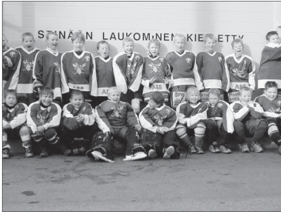
Tarun luistelukoulu turnauksessa Raisiossa.

Tekojääratahanke käynnistyi Tarvasjoella 1991 suunnitelmilla ja henkilöosakkeiden myynnillä. Auranmaan tekojäärata Oy:n perustava kokous pidettiin 23.5.1992 ja seuraavana vuonna päätettiin rakentaa katettu halli. Kun lääninhallitus 1995 nimesi hankkeen läänin tärkeimmäksi liikuntarakentamishankkeeksi ja opetusministeriö myönsi hankkeelle 27.3.1995 1,5 milj. markan avustuksen, voitiin rakentaminen alkaa. Työt aloitettiin maansiirroilla 5.5.1995 ja halli valmistui noin 30 000 talkootuntin vauhdittamana luistelukuntoon 20.10. mennessä. Juhlalliset avajaiset olivat 16.12.1995.