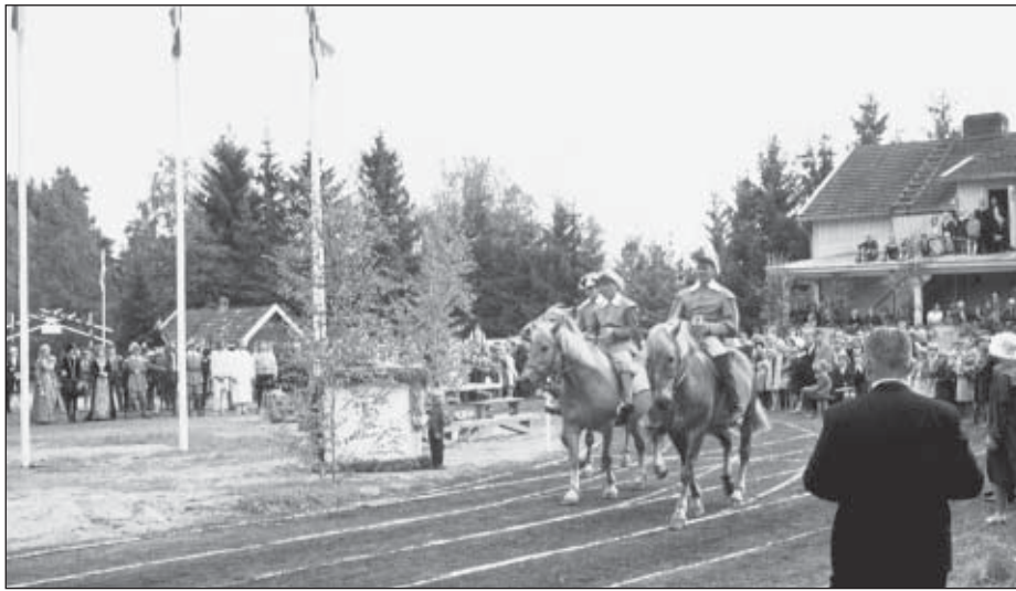
Hakkapeliittaratsukot Tarvasjoen asutuksen 650-vuotisjuhlassa 1966. Dia Eino Saari.

Tarvasjoen historian kirjoittanut tohtori Aulis Oja sanoi hämmästyneensä, kuinka Tarvasjoen kokoinen alue on pystynyt tuolloin lähettämään niin monta ratsumiestä hevosineen ja varusteineen vuosikausiksi etäisiin maihin. Tarvasjoelta oli lähtenyt jo Venäjän ja Puolan sotiin ainakin 8 ratsumiestä ja 30-vuotisen sodan hakkapeliitoista tunnetaan nimeltä 32