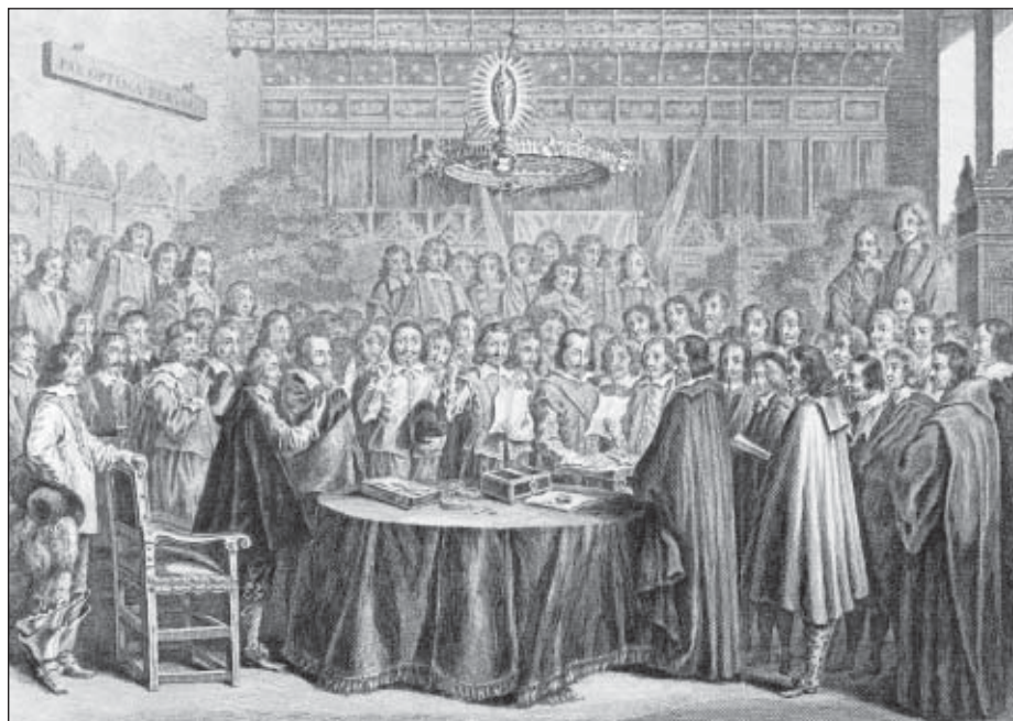
30-vuotinen sota päättyi Westfaalin rauhaan 1648. Museovirasto, kuva-arkisto.

Sommerhausenin kirkonkirjoissa on vuodelta 1631 merkintä miehittäjistä: ”Kun syntyperäinen suomalainen ensiksi saapui Saksaan, hänen nähtiin aina toimittavan pöytärukouksen, ennen kuin asettui pöytään; ja kun hän oli lopettanut ateriansa, ojensi hän kätensä isännälle ja emännälle ja kiitti kohteliaasti kestäytsestä.” Muutama vuosi myöhemmin samat miehet sodan raastamina ryöstivät valtaamia ja miehittämiään alueita kuten muutkin sen ajan palkkasoturit. Ryöstösaalista lähetettiin kotimaahan asti tai kartutettiin mukana kulkevaa omaisuutta.