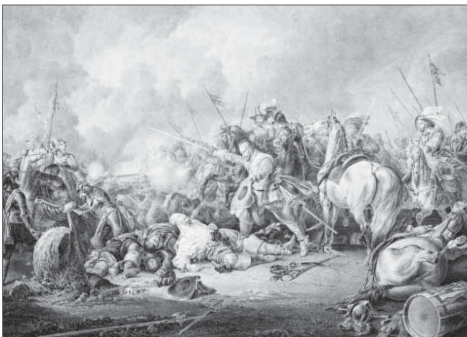
Kuningas Kustaa II Adolfin kuolema Lutzenissä 6.11.1632.