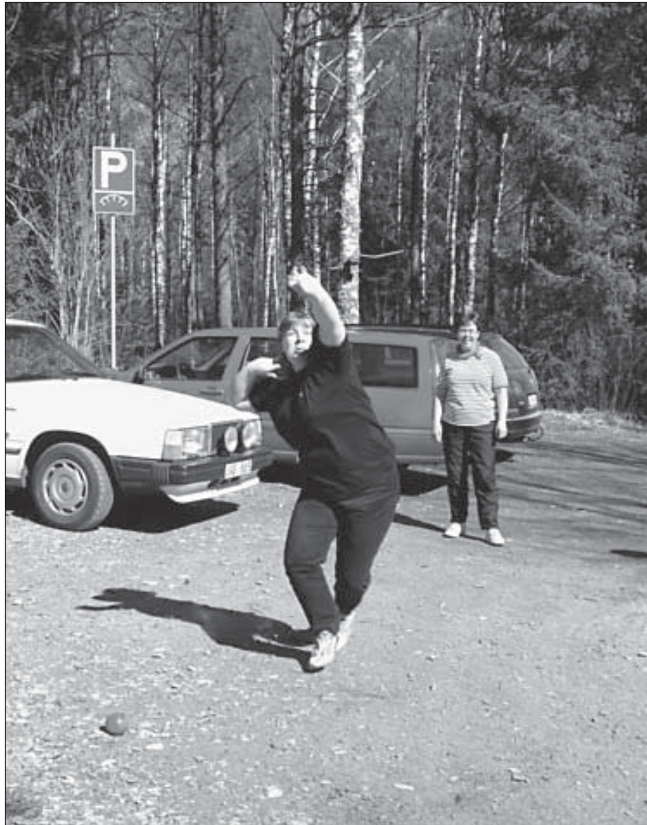
Outi-pappi kuulantyöntöharjoituksissa.