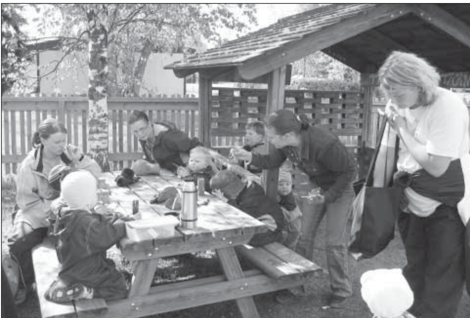
Viikon kohokohta: perhekerho.