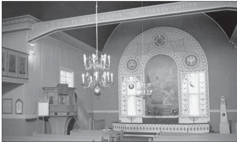
Sisäkuva Tarvasjoen kirkosta.

Näin siis oli pidetty ratkaiseva kokous kirkon rakentamisesta. Rakentamista viivytti se, että eräät seurakuntalaiset eivät ajaneet lupaamaansa puutavaraa seuraavana talvena kirkonmäärälle, vaan vasta myöhemmin. Siksi kirkko jäi kesällä 1778 keskentekoiseksi ja valmistui vasta alku-suvesta 1779. Opettaja Ansa kuvailee kirjassaan uutta kirkkoa näin: ”Varmaankin se näytti aivan erityisen komealta, sekä euralaisille että ohikulkijoille, jotka pitkissä rohdinmekoissaan ja härillä ajaten siitä aikojen päästä verkkaan ohi laahustivat. Varmaan annettiin härkien