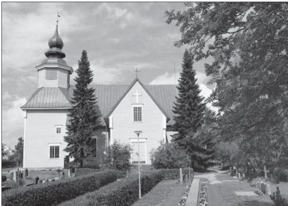
Tarvasjoen kirkko vuonna 2000.

naajan viran perustamisesta Euralle 1771. Jo seuraavana vuonna seurakunta rakensi papilleen virkatalon nykyisen seurakuntatalon paikalle Härkätien varteen Euran kylän yhteismaalle. Emäseurakunta Marttila oli juuri rakentanut uuden kirkon, jonka rakentamiseen tarvasjokelaiset olivat joutuneet tasavertaisesti, joskin kapinoiden, ottamaan osaa. Euran saarnahuonekunnan vanha kirkko oli myös tullut niin huonokuntoiseksi, ettei sitä enää kannattanut korjata, vaikka siihen vielä 1758 oli tehty uusi paanukatto ja se oli ulkopuolelta laudoitettu. Niinpä seurakunnan kirkonkokous 29.5.1774 päätti purkaa vanhan kirkon ja rakentaa tilalle uuden. Päätös oli erittäin merkittävä ottaen huomioon sen hetkisen seurakunnan ja sen taloudelliset voimavarat. Kahdeksan vuoden sisällä se palkkasi itselleen papin, rakensi sille pappilan ja teki uuden kirkon. Tuomiokapituli antoi luvan uuden kirkon rakentamiseen jo 25.6.1774, jonka nopeus varmasti yllätti seurakunnan. Niinpä se otti kolmen vuoden aikalisän.