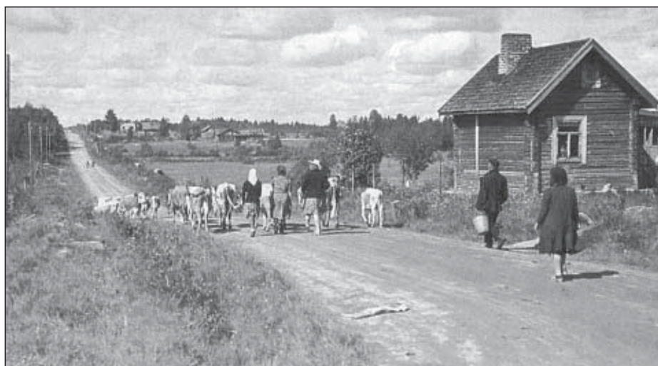
Monen karjalaisnaisen raskaaksi tehtäväksi jäi karjanajo Sisä-Suomeen.

miä ajaen ja lapsista huolehtien oli monille naisille suuri koitos, jollaista he eivät olleet ikinä voineet edes kuvitella. Talvisodan syttymistä oli jollakin lailla osattu jo aavistella, sillä Karjalankannaksella järjestettiin tuolloin ylimääräiset kertausharjoitukset. Sotilaat olivat linnoitustöissä ja liikkuvat tavallisten asuk-