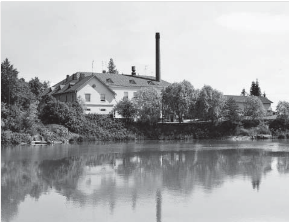
Tarvasjoen-Marttilan Meijeri Oy yli patoaltaan nähtynä.