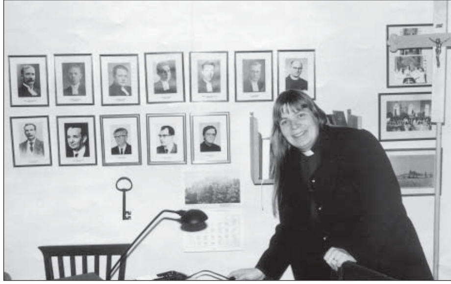
”Nährään kirkos sit pyhäsin”, Outi-pappi.

Suoritamme nuorisotyönohjaaja Kaisa Lahdenkaupin kanssa puolitoista vuotta kestävästä jumalanpalveluskasvatuksen opintokokonaisuutta. Keväällä meidän seurakuntamme tavoitteeksi jumalanpalveluskasvatuksen suhteen asetettiin lapsiperheiden entistä parempi nivoutuminen seurakunnan elämään. Se onkin tärkeä asia, koska meillä riittää lapsia. Samaa hengenvetoon on kuitenkin todet-