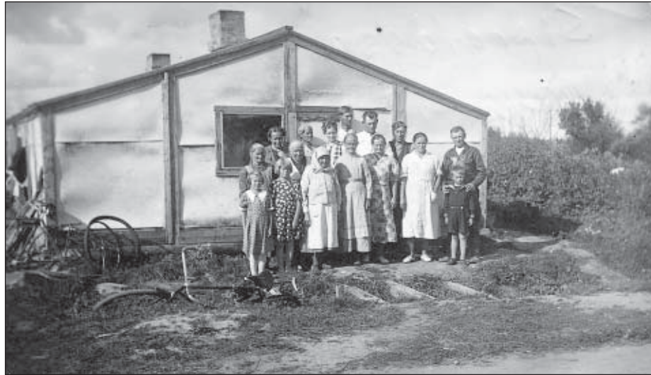
Ensiasunnoksi pystytetty parakki ja sen asukkaat Kuolemajärven Siprolassa kesällä 1942.

Halikon asemalta evakot jaettiin jälleen osin lähes huutokauppaamalla paikallisiin taloihin, joista he sitten myöhemmin saivat lopullisen sijoituspaik-