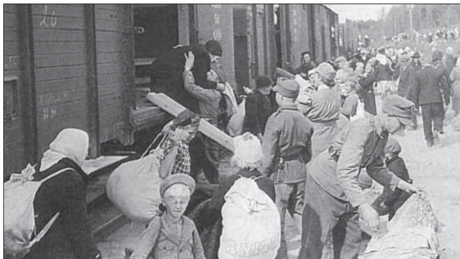
Härkävaunuissa kulki monen matka evakkoon niin 1939 kuin uudelleen 60 vuotta sitten 1944.

Hyvin tyypillinen evakkotaival kulki usean pitäjän ja kunnan kautta ennen vakituisen, lopullisen asuinpaikan löydyttyä. Kuolemajärveltä evakkoon lähdettiin pääsääntöisesti junilla, joita lastattiin asemilla pommikoneiden pyyhkiessä yli taivaan kylväen surua ja murhetta. Naiset ja lapset lastattiin juniin tietyiltä asemilta, joille evakot koottiin yhteistä lähtöä varten. Suurin osa rakkaista tavaroista, eläimistä ja henkilökohtaisesta omaisuudesta jäi kotiin, mukaan sai ottaa sen, mitä jaksoi kantaa. Useilla äideillä oli kantamuksenaan pieniä lapsia, jotka eivät vielä itse kyenneet kävelemään. Muut tarpeellisetkin tarvikkeet saivat siinä tapauksessa jäädä, vain tärkein oli mukana. Talvisodan aikaan kylmä talvi-ilma teki lähdöstä entistä hankalampaa, matkan teko lumisilla teillä jalkaisin eläi-