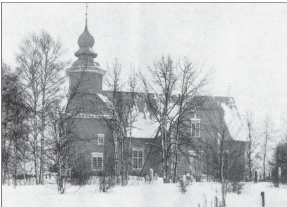
Tarvasjoen kirkko 1800-luvun lopulla. Entisajan puuton kirkonmäki on muuttunut metsäiseksi.