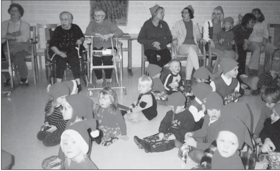
Päivähoitolapset tervehtimässä vanhuksia Palvelukeskuksessa joulunaikana.

Tarvasjoella on tällä hetkellä noin 90 päivähoitoa käyttävää lasta. Muuttovoitokuntana lapsien lukumäärän voisi olettaa kasvavan lähivuosina. Päivähoitopaikkoja on ollut riittävästi ja hoitopaikan on saanut lyhyelläkin varoitusaajalla. Päivähoitopaikkaa tulisi hakea neljä kuukautta ennen hoidon tarpeen alkua, mutta Tarvasjoella hoitopaikka on pystytty järjestämään jopa kahdessa viikossa. Syksyn tilanne näyttää hyvältä, sillä vapaita paikkoja on tällä hetkellä jokaisessa paikassa.