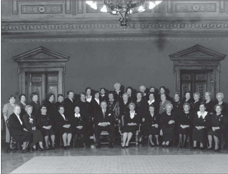
Kunniamerkkiäidit ryhmäkuvassa presidenttiparin kanssa äitienpäivänä 1995.

Vuosien varrella Elina on pyrkinyt pitämään yllä yhteyksiä sukulaisiinsa Venäjällä. Äiti kuoli jo 1957. Sisaruksistaan elää enää yksi sisar Siperiassa. Neuvostoliiton aikana, kun vielä oli vaikea pitää yhteyksiä yllä, hän kesällä 1973 kävi erään matkan yhteydessä kotikyläänsään Kalajoella ja viipyi hetken lapsuuden maisemissa. Kovin on Vepsäkin