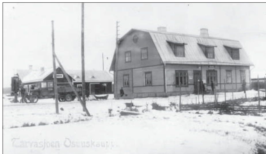
Tarvasjoen Osuuskauppa 1929 ulkoa ja sisältä.