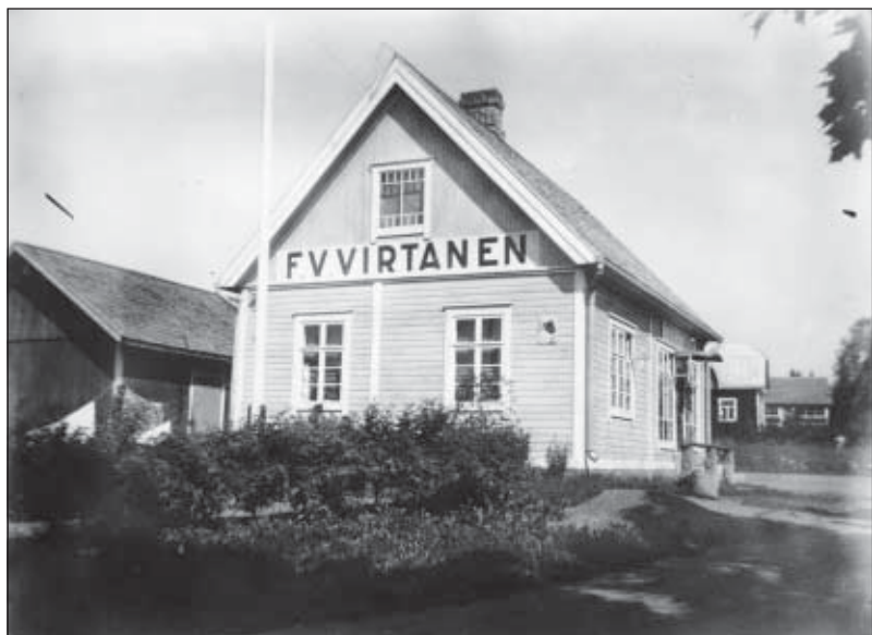
F.J. Virtasen kauppaliike Liedonperässä.