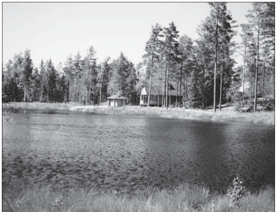
Nykypäivän näkymää Hungerlasta. Niilo Kujanpää