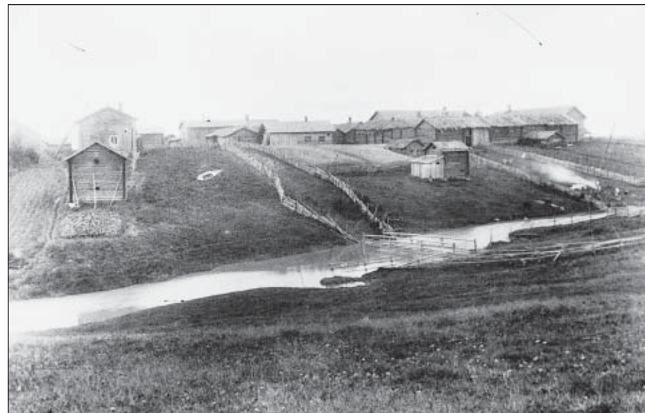
Hyväjalkaisen Miinan kotiseutua.