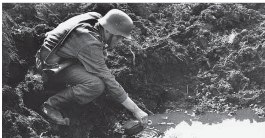
Polttava päivä Ihantalassa.

set sankarivainajat talvisodassa? Vastaus sivu 22