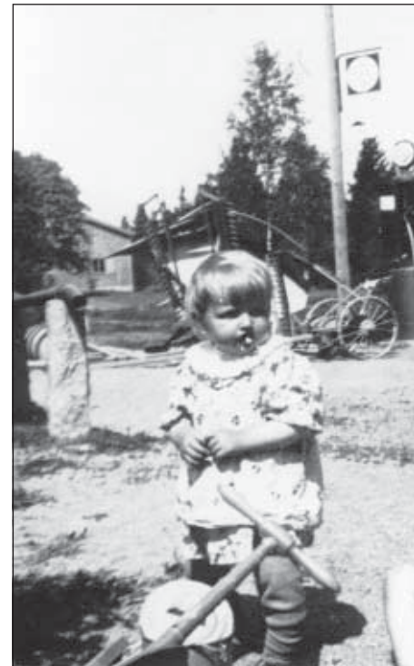
Pikkuasiakas kaupan pihassa 1940-luvulla.

Makasiinissa kerrotaan myös itse rakennuksen historiasta armeijan muona-