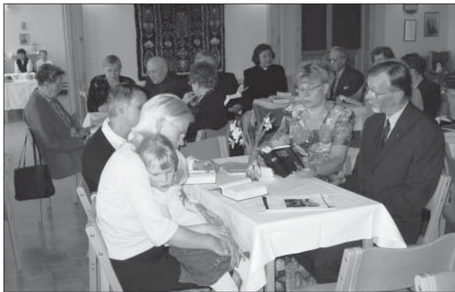
Kuvia lähetyspiiriin 80-vuotisjuhlasta.