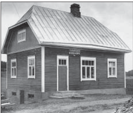
Osuuskaupan myymälä n:o 3 Alikulmalla.

piin alueosuuskauppoihin liittymiseen. Niinpä Loimaan alueelle muodostettiin Osuuskauppa Loimimaa 1980-luvun alussa ja se fuusioitui 1985 Turun Osuuskauppaan. Näiden uudelleen järjestelyjen yhteydessä Tarvasjoen viimeinen SOK:lainen myymälä myytiin ja Timo Mynttinen osti sen K-Tarvasvalinta kaupaksi.