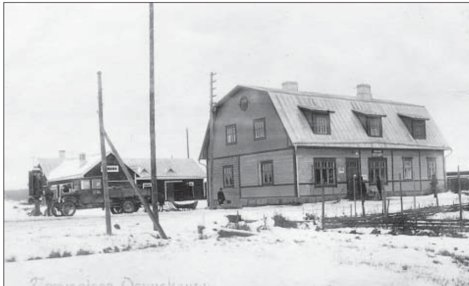
Tarvasjoen Osuuskauppa ilmeisesti joulukuussa 1929.

osuuskauppa, joista Tarvasjoen Osuuskauppa oli toinen, joissa oli rajaton lisämaksu. Näin jäsenet sitoutuivat vastamaan kaupan sitoutumista ja menestymisestä yhteisvastuullisesti. Osuuskauntaan liittyi kuitenkin heti perustamisaikana 115 jäsentä, joista enemmistö oli maanviljelijöitä.