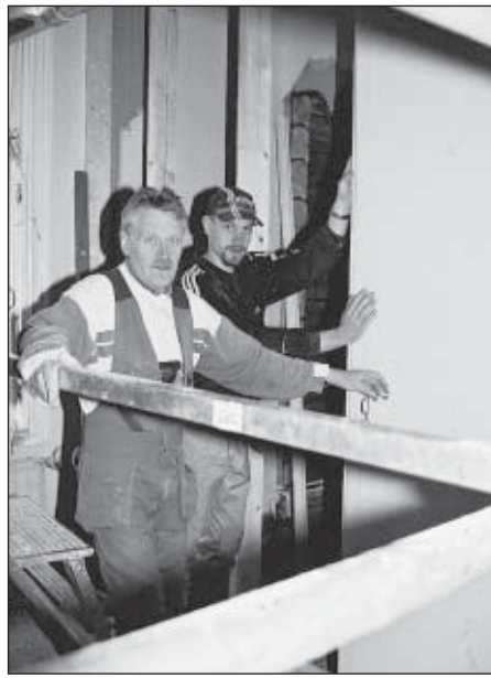
Rakennusmiehet pappilaa korjaamassa.

– Pappilan isompiin huoneisiin palautetaan perinteinen puulattia, joka on tämällytyypisen rakennuksen luonnollinen lattiämateriaali. Se on kestävä niin, että kun se pohjustetaan kunnan koolauksella sitä ei tarvitse aivan heti uusia, kertoo