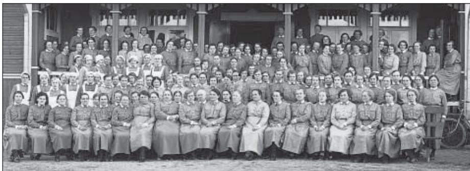
Tarvasjoen lotat yhteiskuvassa ilmeisesti 1939 20-vuotisjuhlan yhteydessä Seurojentalon pihalla.