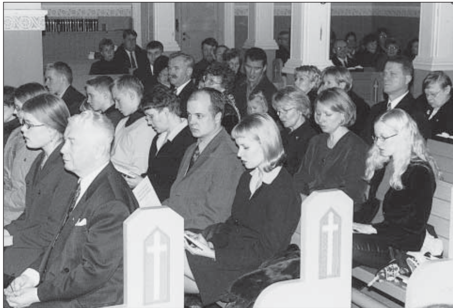
Seurakuntaa virkaan siunaamisjumalanpalveluksessa.