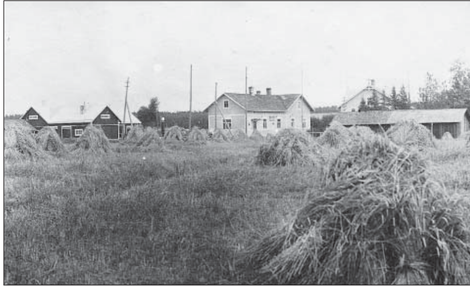
Tarvasjoen Osuuskauppa ennen vuotta 1926.

Suurflakon aiheuttaman valtiollisen jännityksen takia säännöt vahvistettiin vasta vuoden kuluttua 27.12.1906. Sääntöjen mukaan osuismaksu oli 10 Smk. ja lisämaksu rajaton. Se oli niin erikoista, että Suomessa kerrotaan olleen vain kaksi