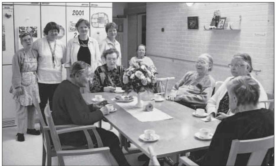
Palvelukeskus sai radioyhteyden kirkkoon. Asukkaita ja hoitohenkilökunta 02.05.2001 uutta yhteyttä kuuntelemissa.