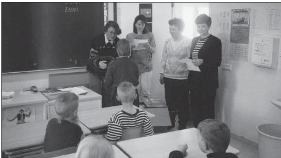
SPR:n edustajat luovuttamassa pyöräilykypäriä ekaluokkalaisille.

Vuodelta 1986 löytyy pöytäkirjamerkintä mm. huomattavasta verenluovuttajien määrästä (131). Nälkäpäiväkeräyksen tuotto oli 1300 mk. Jäseniä osastolamme oli 147.