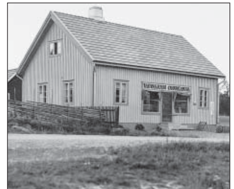
Osuuskaupan myymälä n:o 4 Liedonperässä v. 1936.

Näin päättyi osuuskaupatoiminta Tarvasjoella. Yleisesti ajateltiin, että koko osuustoiminta oli tullut tiensä päähän. Jalo aate, että yhteistoiminnalla saadan suurin hyöty, joka koituu kaikkien, mutta erityisesti yhteiskunnan heikompien parhaaksi ja näin viimekädessä kotiseudun hyväksi, ei Tarvasjoella enää toteutunut. Jäsenet kokivat, että vuosikymmeninä kootut pääomat oli täältä riistetty suurempiin asutuskeskuksiin ja muiden väestöpiirien hyväksi. Hotelliketjut, ravintolat ja ylisuuret tavaratalot olivat tappaneet lähikaupat, joista jokapäiväiset kulutustavarat viime kädessä hankitaan ja jota varten osuuskaupat perustettiin. Onko niihin enää paluuta? Vai olemmeko taantuneet palveluissa 100 vuotta?