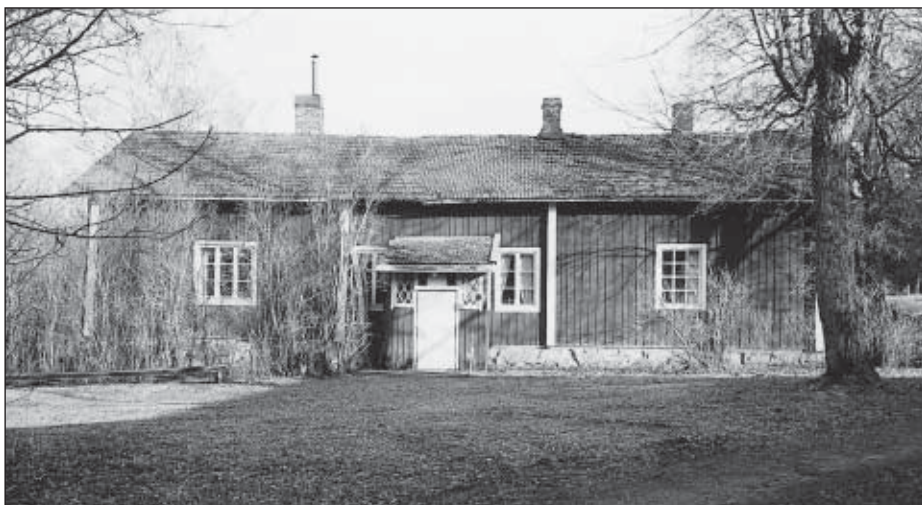
Juvan kartanon vanha päärakennus. K.M. Armfeltin syntymäkoti.

Matka jatkui Puolan kautta Preussiin, jossa sota heidän surukseen oli kuitenkin loppunut. Heillä oli suosituskirje Venäjältä ja sen avulla he pääsivät matkan varrella oleviin hoveihin ja seurapiireihin. Armfelt sokeutuu kuitenkin Berliinissä yhteen monista rakkausseikkailuista, jolloin Sprengtporten jätti hänet yksin jatkamaan matkaa Strasbourgiin ja Pariisiin. Täällä Kustaa tutustui, paitsi hienoon hovielämään Ludvig XVI hovissa, myös teatterin kiehtovaan maailmaan. Täälläkin hän joutui rakkausseikkailuihin, joiden hedelmänä eräs näyttelijätär synnytti myöhemmin pojan. Tästä Maurice-pojasta tuli myöhemmin Ruotsin