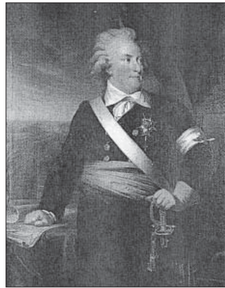
C.F. von Breda: Kustaa III. Joensuun kartano.

Aleksanteri I ja Napoleonin solmittua rauhan Austerlitzin taistelun jälkeen 1807 Tilsitissä alkoi Armfelt pelätä, että Venäjä valtaa Suomen. Hän kehoitti kuningasta nyt pyrkimään rauhaan ja liittoon Venäjän kanssa, mutta kuningas ei kuulut häntä, vaan nimitti Ruotsin armeijan ylipäälliköksi W.M. Klingsporin. Armfelt oli varma, ettei täysin varustautumaton Ruotsi voisi estää Suomen valloitusta, jos sota syttyy. Helmikuun 2. päivänä 1808 saapui Tukholmaan tieto, että venäläiset olivat hyökänneet Suomeen sotaa julistamatta. Armfelt oli työnnetty sivuun Ruotsin läntisen armeijan komentajaksi ja hän voi vain sivusta kat-