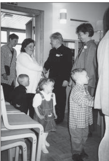
Nelivuotiaat vanhempineen saapumassa synttärijuhlaan.

Seurakunnan kasvatustyönjohtokunta oli jo hyvissä ajoin puuhastellut kaikille tänä vuonna 4-vuotta täyttävälle oman syntymäpäiväjuhlan.