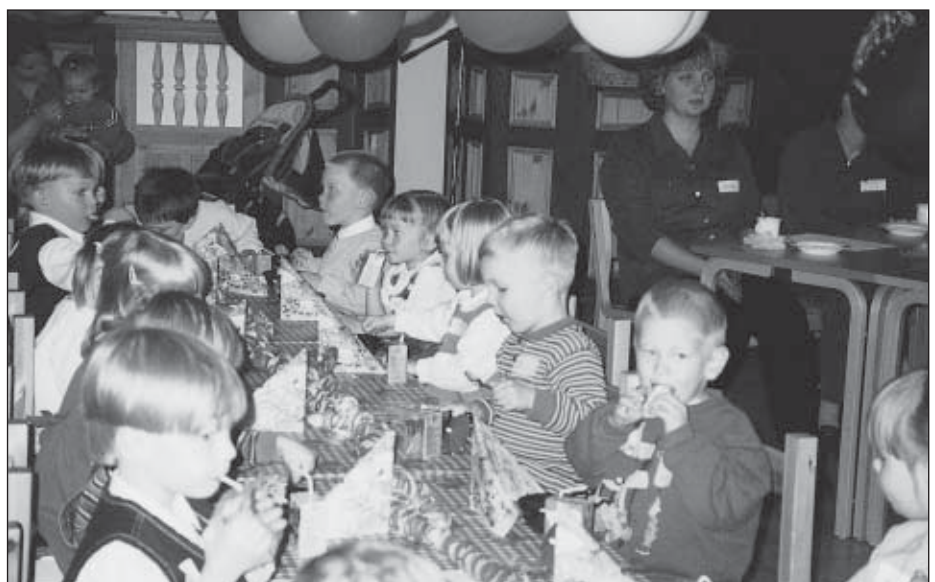
Oli hienoa nähdä, miten arvokkaasti pienet juhlapäivän viettäjät asettuivat juhlapöytään, johon heille tarjottiin maukkaat synttärimaistiaiset.