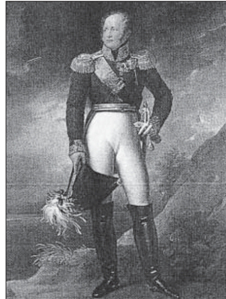
F. De Gérard: Aleksanteri I muotokuva. Helsingin yliopisto.

soa Suomen valtausta. Vuoden vaihteessa 1808-1809 Suomi oli irroitettu vuosisataisesta yhteydestään Ruotsiin ja liitetty Venäjään. Armfelt tunsikin aina olevansa suomalainen ja Suomi oli hänen kotimaansa.