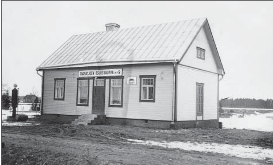
Tarvasjoen Osuuskaupan Suurilan myymälä.