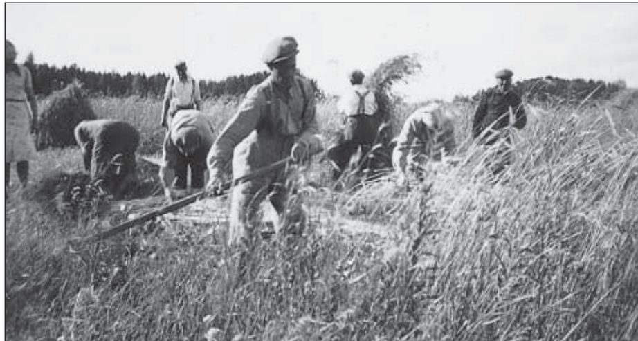
Elopellolla viime vuosisadan alkupuolella.