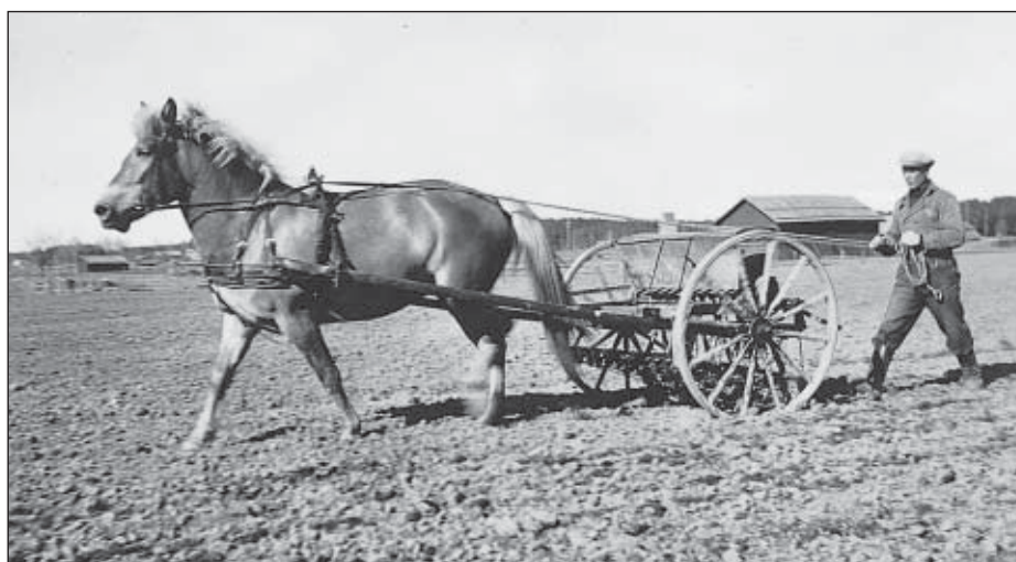
Hevosvetoinen rivikylvökone oli eräs ensimmäisistä maatalouden koneista 100 vuotta sitten.

Tarvasjoen maamiesseura lähti ripeästi liikkeelle. Sen johtokuntaan valitut piirimiehet keräsivät jäseniä ja tilauksia siementen, apulannoitusaineiden ja maanviljelyskalujen yhteisostoon. Johtokunta päätti hankkia oja-auran jokaiseen piiriin, sillä suuritöiset avo-ojat oli siihen asti luotu lapiolla. Jo 1900 hankittiin neljä oja-auraa yhteiskäyttöön. Lypsykarjaloudesta tuli erityinen neuvonnan kohde, kun 1880-luvulla oli perustettu Juvalla meijeri ja maitoa ei tarvinnut itse jalostaa kotivoiksi. Karjanjalostus otti ensiaskeleitaan ja maamiesseuran toimesta perustettiin 1903 Euran kap-