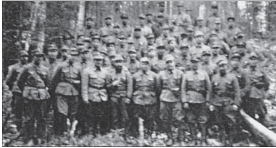
Kotipitäjän vieraiden tultua koko komppania koottiin kuvaan.

Kunnanvaltuusto on t.k. 6 p:nä päivätyllä kirjelmällä kääntynyt puoleeni ja selostettuaan Tarvasjoen kunnasta kokoonpannun yksikön tappioita ja miehistön monista urhoollisesti suoritetuista taisteluista aiheutunutta väsymystä anonut, että tälle miehistölle nyt myönnettäisiin kolmen viikon yhtäjaksoinen loma tai jos se käy päinsä, että heidät siirrettäisiin joksikin aikaa pois kärki-