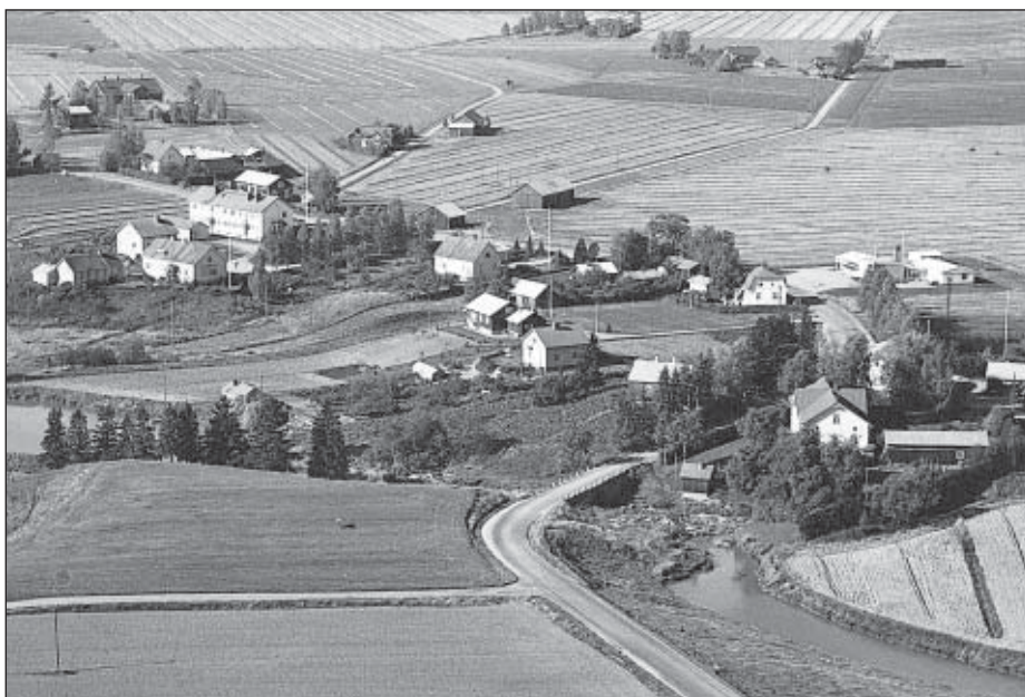
Tarvasjoen keskusta 1961 idästä päin katsottuna. Kuvassa näkyy yli kymmenen jo purettua rakennusta ja uutta rakennuskantaa edustaa vasta Tarvala ja Säästöpankki.