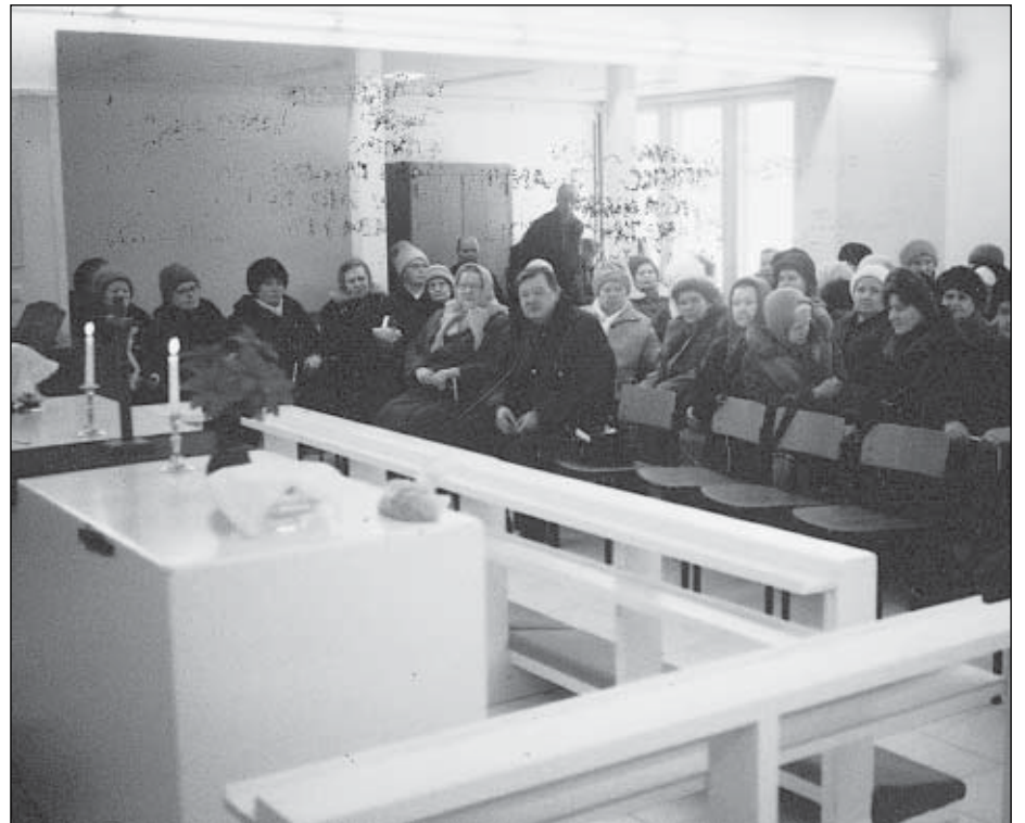
Seurakunta kokoontui väliaikaisessa kirkossa eli suomalaisten rakentamassa seurakuntatalossa.

Seurakunta kokoontuu kokoonsa näiden aktiivisesti jumalanpalveluksiin, jot-