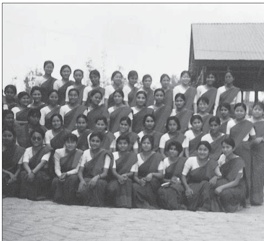
Lalitpurin Nursing Campus 1999 aloittaneet sairaanhoitajaopiskelijat.