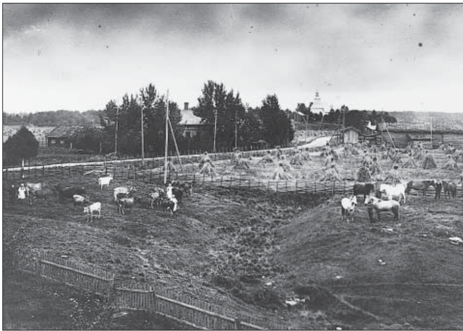
Tarvasjoen kirkonseutu v. 1925 Päivärinnan suunnalta katsottuna.

Viinan kotipolttolito oli 1856 kielletty ja siitä oli tullut valtion monopoli. Kunnat saivat osan viinan myynnistä tulleista viinaverorahoista. Samalla kunnan oli valvottava ja estettävä kotipolttolito. Kunnat saivat toimintansa rahoittamiseksi kunnallisveron eli kuntarahan koontioikeuden. Se perittiin mantaaliin pannun