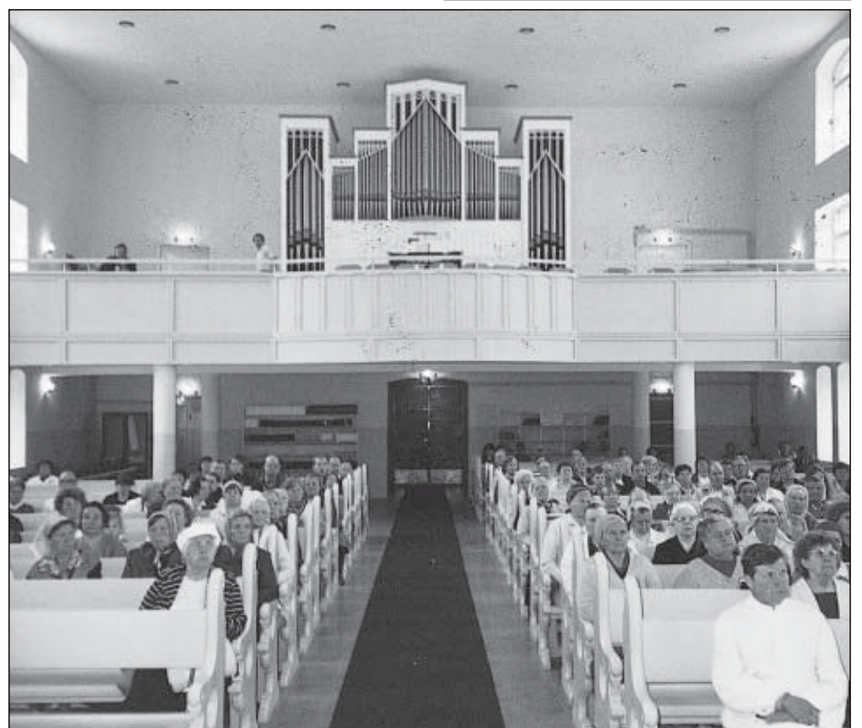
Aleksanterin kirkko nykyisessä asussaan.

Su 29.8. klo 10 Esko Haapalainen saarnaa Tarvasjoella klo 19 urkukonsertti Olga Minkkina