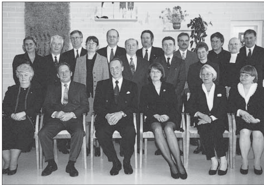
Tarvasjoen kunnanvaltuusto juhlahetkenä 9.4.1999 kunnan täyttyessä 130 ja kunnanvaltuuston 80 vuotta

Tarvas-Hovin valmistumisesta alkoi kunnan nopean kehittämisen ja rakentamisen vuosikymmenet. Ensimmäinen kerrostalo nousi keskustaan 1970 säästöpankin rakentamana ja seuraavana vuosina nousi uusia asuntoja keskustaan ja sen kaavoitus alkoi. Samana vuonna kun-