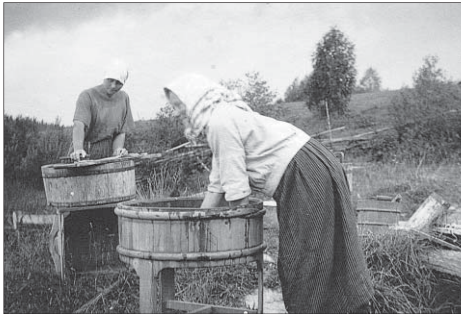
Pyykkiä pruukattiin pestä pyykkipunkassa.

neulomaan, ei saanut sitä PRENKATA (käyttää varomattomasti). Kutoa-sanaa käytettiin niin sukien kuin kankaiden kutomisesta kangaspuissa, joiden murren sanan olen unohtanut. Kenties joku vielä muistaa senkin?