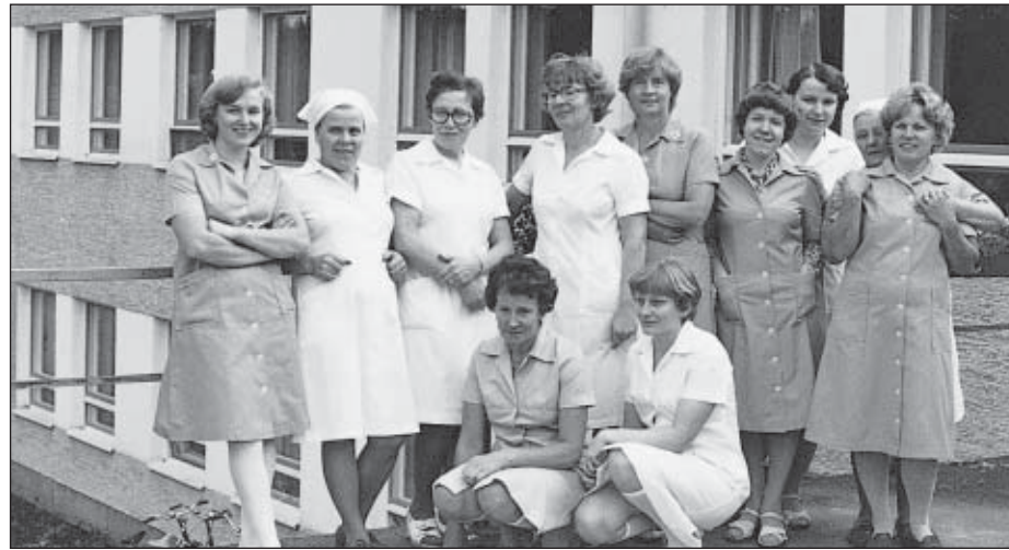
Vanhainkodin henkilökuntaa 1910-luvulla.