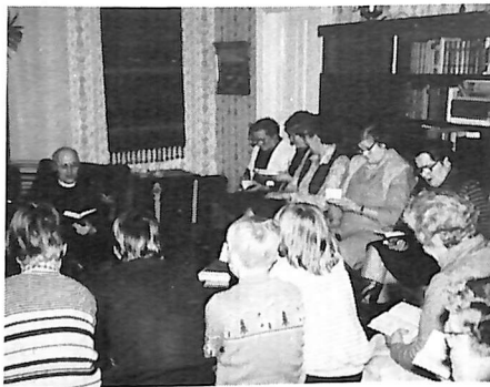
Myös rippikoululaisia mukana suorittamassa seurakuntaan tutustumistehtäväänsä.

tämän lähetys- ja diakoniapiirin luokseen kutsuvia koteja. Näin on kannettu vastuuta sekä kaukana että lähellä olevasta apua tarvitsevasta lähimmäisestä. Näille kodeille annettakoon kiitos vieraitten kestitsemisestä.