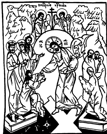
KRISTUS NOUSI KUOLLEISTA — TOTISESTI NOUSI

Toiseksi Kristuksen ylösnousemusta on syytä tähdentää tämän teeman äärellä: Jeesuksen ihmeteot voivat aueta vain Kristuksen ylösnousemuksesta käsin. Jos muulla tavalla tätä kysymystä tutkimme, olemme harhapolulla. Sivukysymyksistä tulee muuten pääkysymyksiä. Voimme pohtia ihmekysymystä yleensä, ovtko ihmeit mahdollisia. Mutta kaikki on täysin turhaa, jos emme usko ihmeitten ihmeeseen: KRISTUS ON YLÖSNOUSSUT. KUOLEMA ON VOITETTU!