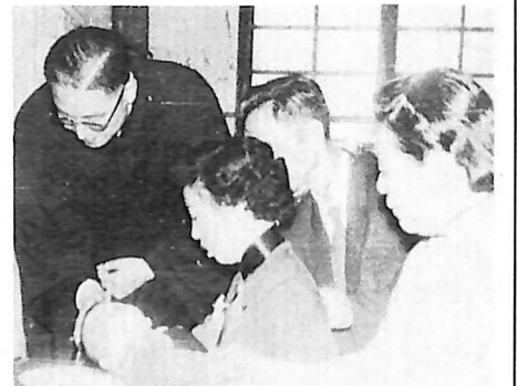
Jumalan seurakunta on saanut yhden uuden taiwanilaisen jäsenen.

Kannustakoon tämä hyvä tulos meitä edelleenkin sekä taloudellisesti että rukouksin muistamaan Herramme lähetyskäsken mukaisesti evankeliumin sanoman levittämistä kaikkien kansojen keskuuteen!